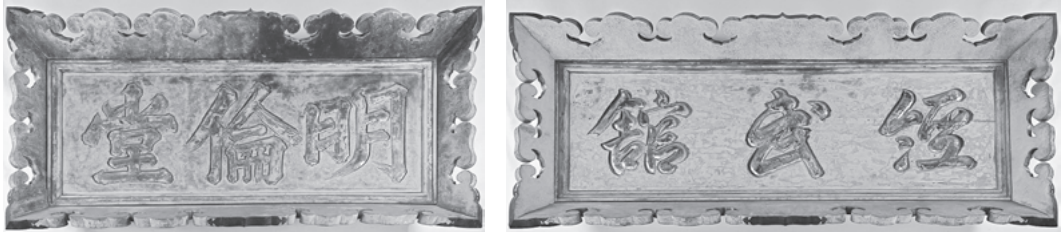
写真1 加賀藩校の扁額 明倫堂（左）、経武館（右）