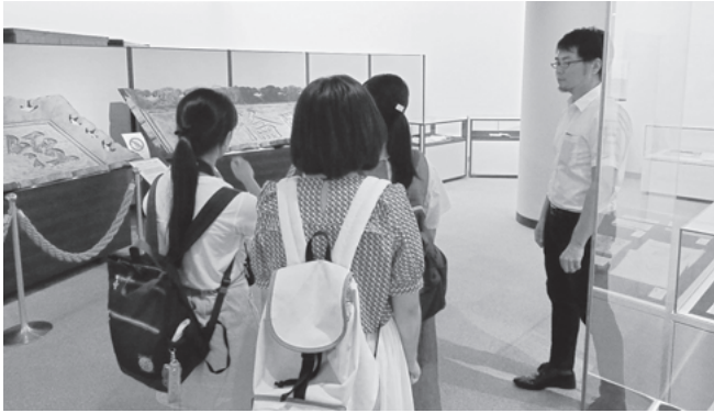
写真2 特別展ミュージアムツアーの様子