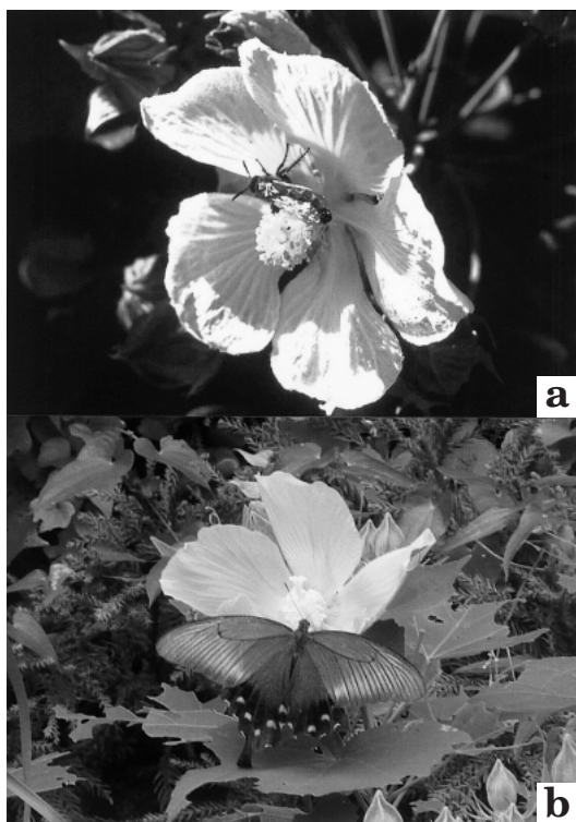
Fig. 2. Insects visiting on a flower of Hibiscus . a: Andrena sp. on H. makinoi . b: Papilio maackii on H. mutabilis .

Numerical value indicates the number of individuals visited flowers for three hours.