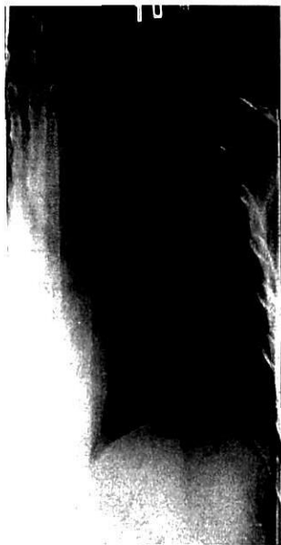
図 2. 胸部断層像