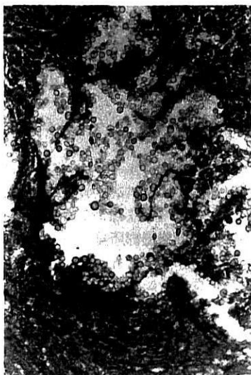
a. 生検組織標本(PAS 染色, \times 100 )