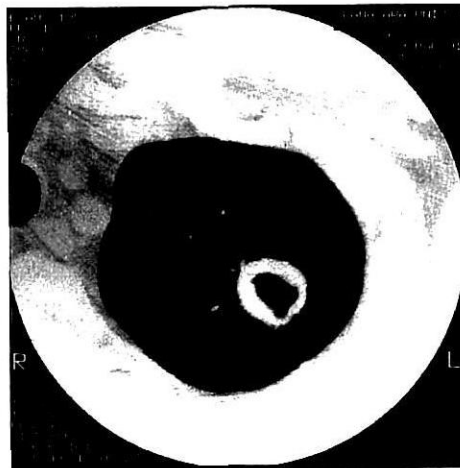
図 3. 胸部 CT スキャン