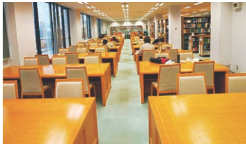
開放的な空間でゆったりと勉強

静かな場所で集中して勉強したいあなたには、書架周辺にある閲覧席がおすすめです。閲覧席には、写真のように2つのタイプがあります。用途に応じて、ご利用ください。