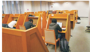
仕切りのついた机で集中して