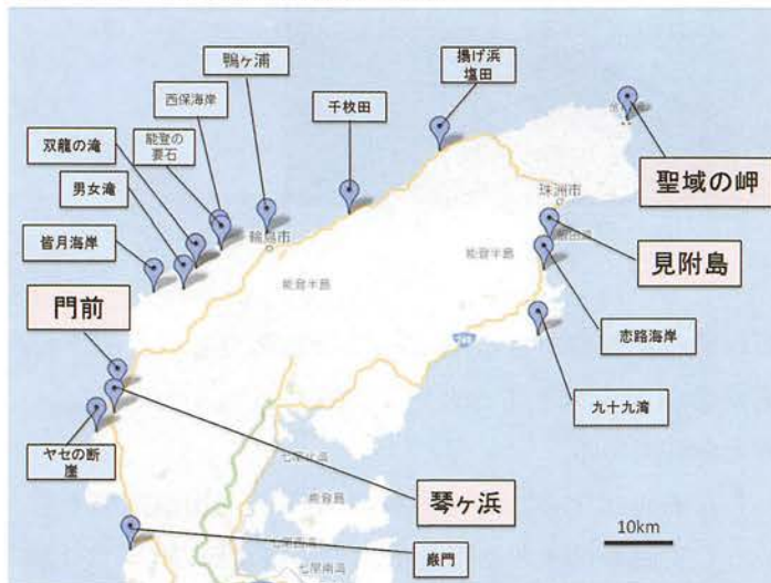
図2 能登のジオスポット一覧

島市門前地域については地質分布図を作成した。内浦の堆積岩についても、試料を採取し肉眼観察を行った。