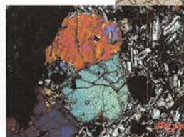
(左)図 5a 板状節理 (右 2 枚)図 5b 薄片観察 下: クロスニコル 上: オープンニコル