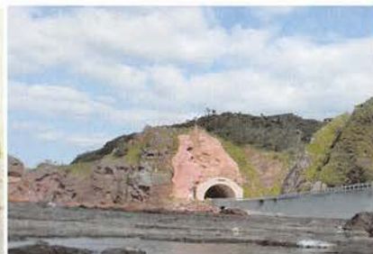
(左)図 4b スコリア丘の 模式断面図 (右)図 4c スコリア丘 (海側から)