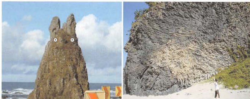
(左)図 6 トトロ岩

琴ヶ浜には無料の駐車場が設備されている。また、浜辺に下りるときにはコンクリートの歩道があるので、気軽に見学することができる。