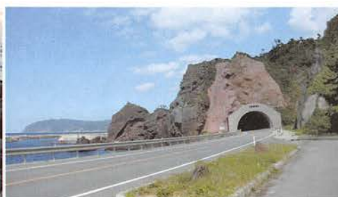
(左)図 3. 大泊の 枕状溶岩の産状 (右)図 4a スコリア丘