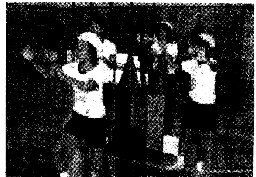
写真2 Aグループ(上)、Cグループ(下) ゲームの様子

ここで、再度本時のテーマを確認し、それに一番合致したと思われるゲームについて各グループでまとめるととも