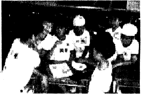
写真1 事前のプランづくり

前回プランづくりがうまくいかず、その後の活動に支障があったグループが見られたため、今回は十分に時間を保証することにした。まず、「ルールによっては攻守どちらかが有利になること」や「ゲーム構成3要素をバランスよく取捨選択するとよいこと」を全体に伝え、予めいくつかのゲームパターンを用意しておくことを指示した。これは、前回の活動でゲームの間に話し合いをしたため、ルール変更等の意思統一や新たな用具の準備に時間がかかってしまい、実際に体を動かして確かめることができなかつたり、ゲームをすることに関心があつてグループ内で話し合いによる十分な意思疎通ができなかつたりしたためである。そして、前回のグループカードと個人カードをもとに反省点を出し合い、今回のゲームプランをたてていくことにした(表4参照)。