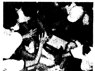
写真3 ゲームのふりかえり

ゼミと教科や特別活動との違いや生涯学習とのかかわりが論点になっている。これからは、子どもの自己評価だけでなく教師の評価の在り方、ゼミの内容や学習（指導）方法の確立が必要になってくると思われる。最後に、遊びの創造者達と共に時間と場、活動を共有できたことを喜びに感じる。そして、これらの活動が彼等にとって有意義なものであってほしいと願っている。