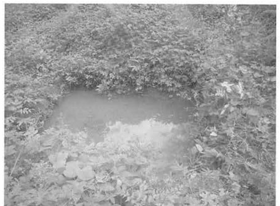
図3 調査地に造成したため池。 Fig. 3 A pond constructed in of the study site.