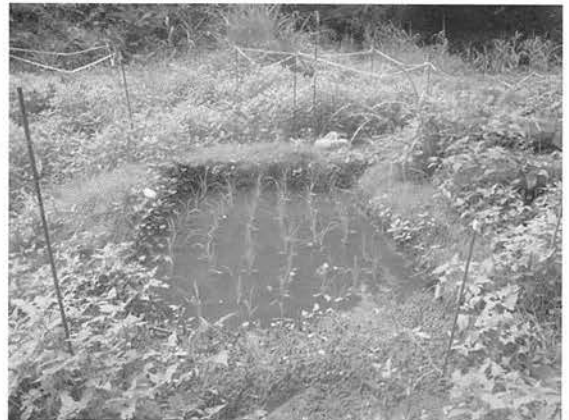
図2 調査地に復元した水田。 Fig. 2 A paddy constructed in the study site.

2012年4月29日から5月13日にかけて、谷の平坦部全体に渡って低木や雑草を除去し、実験用水田16個（図2）と、ため池4個（図3）を造成した。ひとつの水田の面積は約4m 2 、深さ10cmとし、谷の全体に渡っ