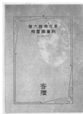
≪挿圖 2.≫ (大約3/5)