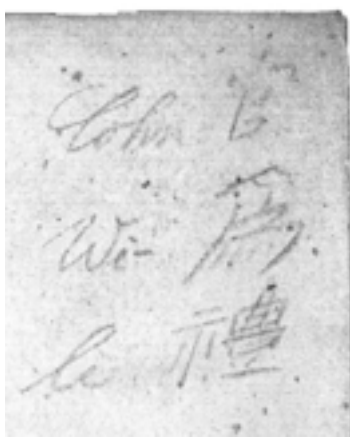
≪挿圖 1b.≫ (大約3/4)