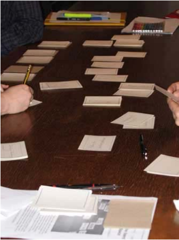
Abb. 3: Die Karteikarten werden geordnet, gestapelt und die Stapel benannt.

Zum Abschluss werden die Karteikartenstapel in einer Menüstruktur ausgelegt und überprüft (siehe Abb. 4). Dabei können nochmals Ergänzungen, Umgruppierungen oder Änderungen vorgenommen werden.