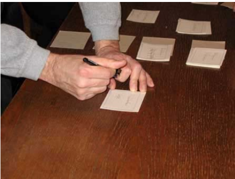
Abb. 1: Die Karteikarten werden beschriftet.

Die Anwendungsalternative 1 besteht üblicherweise aus folgenden vier Schritten: An die Teilnehmer werden leere Karteikarten ausgegeben. Die Teilnehmer beschriften, jeder für sich, die Karteikarten mit einem Thema je Karte (siehe Abb. 1).