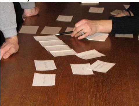
Abb. 2: Die Karteikarten werden gesichtet, besprochen und ergänzt.

Dann werden in der Gruppe alle Karteikarten gesichtet und besprochen, wobei Dubletten aussortiert, verwandte Themen zusammengelegt und fehlende ergänzt werden (siehe Abb. 2).