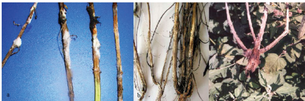
Slika 1. S. sclerotiorum : bela trulež na E. purpurea (a), nekroza i izumiranje stabla i bočnih grana sa pojavom crnih sklerocija (b), i trulež korena i prizemnog dela stabla na belom slezu (c).

Figure 1. S. sclerotiorum : white stem rot on E. purpurea (a), necrosis of steem and root and formed sclerotinia (b), and necrosis of root and root crown on marshmallow (c).