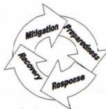
Šema 3 - Faze upravljanja vanrednim situacijama [9]