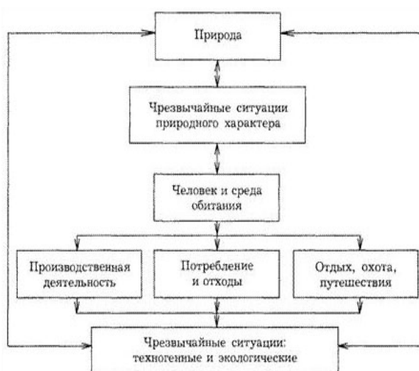
Šema 2 - Uzajamno dejstvo vanrednih situacija, prirodne sredine i aktivnosti čoveka [6]

Vanredna situacija je stanje kada su rizici i pretnje ili posledice katastrofa, vanredna događanja i druge opasnosti po stanovništvo, životnu sredinu i materijalna dobra takvog obima i intenziteta da njihov nastanak ili posledice nije moguće sprečiti ili otkloniti redovnim delovanjem nadležnih organa i službi, zbog čega je za njihovo ublažavanje i otklanjanje neophodno upotrebiti posebne mere, snage i sredstva uz pojačan režim rada [3].