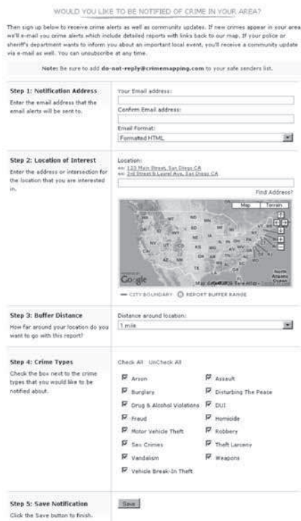
Слика 2 – Регистравање корисника за услугу обавештавања путем e-mail -а о стању и кретању криминала 9

упозоравају да је на подручју на којем они живе увећан ризик од виктимизације, и притом добијају савет како да се заштите, на шта да обрате пажњу и сл. На сличан начин као телефонски бројеви, из базе података се могу добити e-mail адресе претходно регистрованих грађана (слика 2), бројеви мобилних телефона на које би се слале СМС поруке итд.