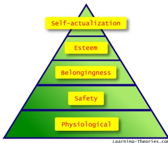
Slika 1 - Maslovljeva hijerarhija ljudskih potreba, (izvor: www.learning-theories.com/wp-content/uploads/2007/03/maslows-hierarchy-of-needs.jpg )

U cilju zadovoljenja jedne od najvažnijih ljudskih potreba i ispunjenja jednog od preduslova održivog razvoja, borba protiv kriminala zauzima značajno mesto. Cilj ovog rada je da ukaže na značajan uticaj prevencije kriminala kroz oblikovanje prostornog okruženja ka ostvarenju ciljeva održivog razvoja, kroz fizički, društveni i ekološki aspekt u odnosu na savremene pristupe prevencije kriminala.