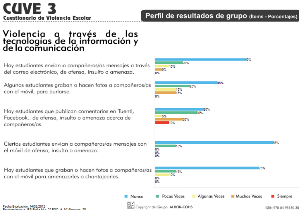
Figura 3. Ejemplo de Perfil de resultados de grupo (Ítems-Porcentajes) obtenido con la aplicación del CUVE 3 -ESO (una de sus páginas).