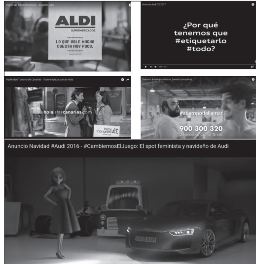
Imagen 1. Campañas de análisis: Aldi supermercados, Audi Q2, Islas Canarias, Svenson y Audi felicitación de Navidad