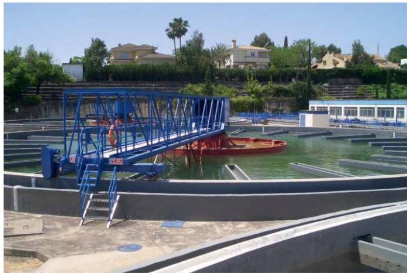
Kuva 7. Esimerkkikohteena EDAR El Carambolo in Sevilla (Espanja) vedenpuhdistamo, jonka kunnostamiseen käytettiin myös BASF:n MasterSeal tuotteita. Hanke valmistui vuonna 2009. [10]

Haasteellisia ovat myös vedenpuhdistamot, joihin kohdistuu happosateista, jäätymisestä, sulamisesta, voimakkaista vesivirroista ja korkeista sulfaattipitoisuuksista johtuvia kulumisia. Tämän takia betonipinnat rapistuvat nopeasti ja raudoitukset ruostuvat. Esimerkkikohteena Sevillan vedenpuhdistamolaitos kuva 7. [10]