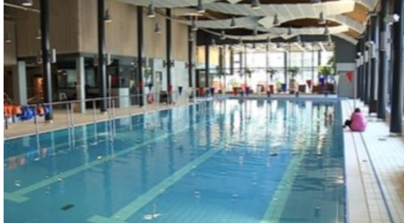
Kuva 1. Valmis Härmän kuntokeskuksen kuntoallas. [5]

Esimerkkinä korjatulle allasrakenteelle käytetään Tapio Kallioniemen opinnäytetyön Härmän kuntokeskuksen uutta uima-allasta. Uima-allas on siis aivan uusi ja siitä huolimatta siinä on jo havaittavia halkeamia rakenteen seinämissä. Halkeamien syntyperäksi arvioitiin sisäiset pakkovoimat ja pitkäaikainen kuivumiskutistuminen muottien purkamisen jälkeen. Rakenne korjattiin pääasiassa bentoniittinauhalla ja yksittäiset halkeamat täytettiin muovipohjaisella injektioaineella. [5]