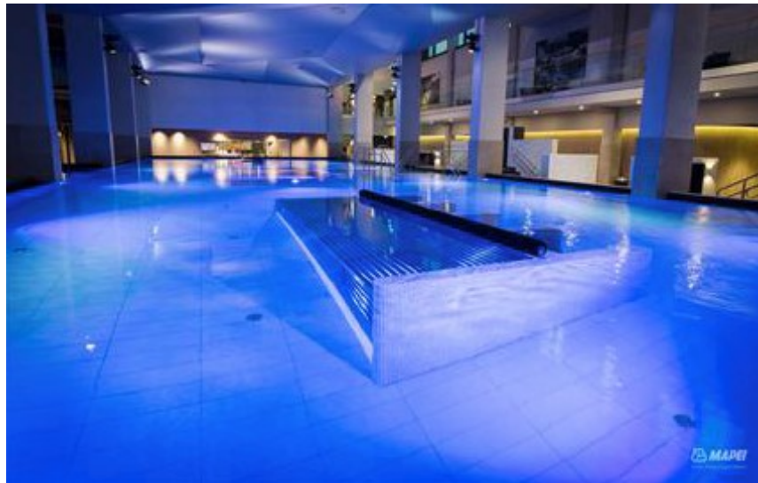
Kuva 9. Yksi MAPEI:n kohteista on ollut 2015 valmistunut yksityiskylpylä ”The Well”, jossa käytettiin epoksipohjaista MAPEPOXY BI-IMP -injektioainetta. [13]

Epoksivalikoimassa on myös kattava määrä eri PRIMER –tuotteita betoni pohjusteiksi. Polyuretaanipohjaisiksi tuotteiksi voidaan luokitella ainakin: