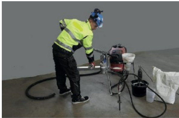
Kuva 4. Halkeaman sementti-injektointi [1, s. 1].

Injektointibetonointi on yksi injektointimuodoista. Injektointibetonointi perustuu suljetun tilan täyttämiseen muotissa. Ennen injektointia muotti on täytetty kiviaineksella, minkä jälkeen muottiin jääneet tyhjät kohdat injektoidaan täyteen sementtilaastilla. Sitä käytetään lähinnä laajojen vesivaurioiden, sekä pilareiden yläpäiden korjaamiseen. Työ vaatii erityistä asiantuntemusta, jolloin injektointibetonointi on hieman harvinaisempi korjausmuoto allasrakenteissa. [1, s. 37]