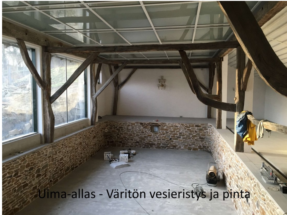
Kuva 10. TKR:n uima-allas kohde, joka saatiin tiivistettyä ja korjattua värittömällä pinnoitteella, jolloin säilytettiin altaanreunan kuviointi. [18]

niistä hyviä esimerkkejä. Pinnoitetta on saatavilla 9 eri väriä, joista esimerkkinä värityön/valkokuulto kuvassa 10. [18]