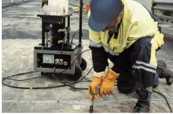
Kuva 3. Halkeaman muovi-injektointi [1, s. 1].