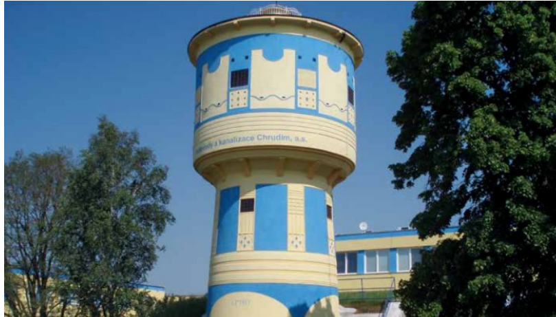
Kuva 6. Esimerkkikohteena vesitorni Chrudimissa (Tshekin tasavalta), joka suojattiin ja vesieristettiin BASF:n tuotteilla. Hanke valmistui vuonna 2008. [10]

Haasteellisia ovat myös vedenpuhdistamot, joihin kohdistuu happosateista, jäätymisestä, sulamisesta, voimakkaista vesivirroista ja korkeista sulfaattipitoisuuksista johtuvia kulumisia. Tämän takia betonipinnat rapistuvat nopeasti ja raudoitukset ruostuvat. Esimerkkikohteena Sevillan vedenpuhdistamolaitos kuva 7. [10]