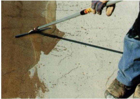
Kuva 5. Halkeaman imeyttäminen [1, s. 39].

Pienet plastiset halkeamat 0,1-0,2mm korjataan imeyttämällä. Imeytys ei kuitenkaan korjaa halkeamia rakenteellisesti, joten ne eivät ole verrattavissa injektointiin. Halkeamat imeytetään vasta kahden viikon kuluttua valusta. [1, s. 14]