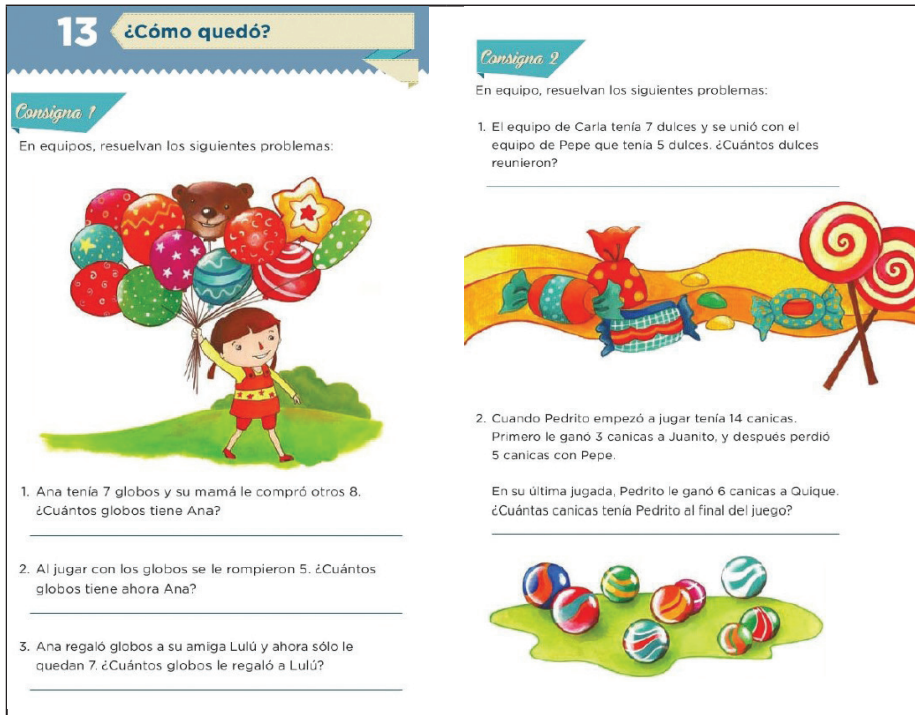
Figura 5. Ejemplo de tarea en el libro de texto de primaria (SEP, 2015: 30).

En esta tarea 13 se promueve la idea del signo igual en su significado como resultado de operación, por lo cual la cantidad desconocida queda asociada a un carácter procedimental que denota la expresión a + b = \blacksquare , con a y b conocidos. La solución implica el uso de operaciones aritméticas encadenadas e indicadas en el enunciado del problema, por lo que no es posible implicar al estudiante en la comprensión y aplicación de propiedades de las operaciones.