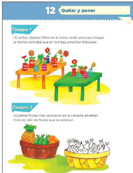
Figura 3. Ejemplo de tarea en el libro de texto de primaria (SEP, 2015: 29).

mesa naranja para determinar el número de objetos que están sobre ella, es decir 9; luego tendría que iniciar el conteo de los jarrones de la mesa verde, o sea 5, y continuar hasta que llegue a 9. Así obtendría la respuesta. De manera similar puede resolver lo que se indica en la consigna 2, coloreando las frutas de la canasta amarilla. Realizar este conteo no implica un acercamiento a formas de pensamiento proto-algebraicas, pero de la tarea emerge la noción de equivalencia, que es posible potenciar para promover el pensamiento algebraico, proporcionando otras indicaciones al estudiante.