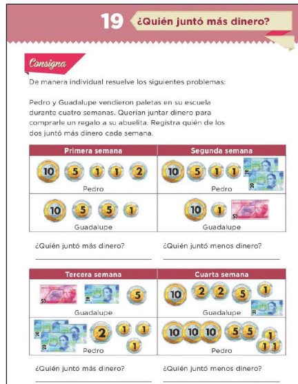
Figura 7. Ejemplo de tarea en el libro de texto de primaria (SEP, 2015: 41).