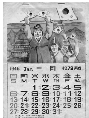
写真6 1946年のカレンダー

とりわけ檀紀が復活したことが注意を引く。他方では、昭和も皇紀も消えている。檀紀はその後、1948年の大韓民国の成立とともに正式な紀年法として採用され、1961年までつづいた。国際化ないし近代化にともない、西紀が檀紀に取って代わるのはそれ以降である。