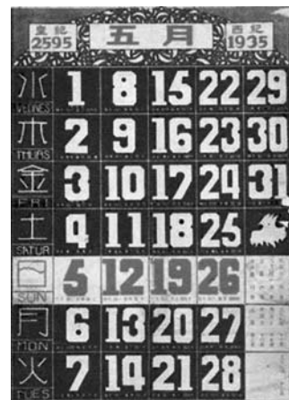
写真4 皇紀2595年のカレンダー

この日めくりも朝鮮仕様のものとは考えにくい。それにしても、西暦はまだしも、昭和の元号がなく、皇紀のみとしたら、めずらしい部類に入るかもしれない。