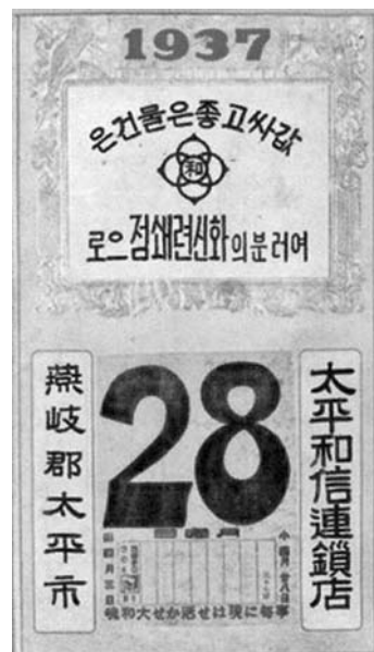
写真5 1937年のカレンダー

すし謎めいた暦である。台紙とおぼしきところには1937の数字があり、日めくりのような日表には28の数字の下に月曜日と見える。だが、1937年の4月28日は月曜日ではなく水曜日である。小の月4月28日で旧暦4月3日とあるから、1937年前後でそれにあたる年を探してみると、1941年しかない。その日は丙丑、四緑、赤口であり、