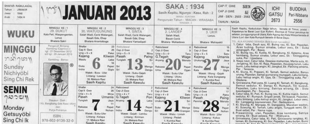
写真 10 2013 年のバリ・カレンダー

現在のバリ・カレンダーにふたたび皇紀が使われている。たとえば、Bangbang Suarte 氏の本カレンダーには ICHIGATSU 2673 とみえる。曜日にも Nichiyōbi, Getsuyōbi という記載がある。これとは別の製作者によるカレンダーには Heisei の表記もあった。このように多様な暦法のなかに日本統治時代の痕跡が残っている例はめずらしい。