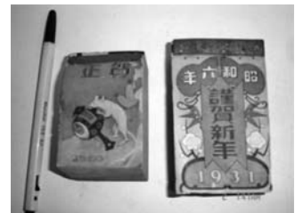
写真2 昭和6年(右)と皇紀2596年(左)の日めくり(表紙)