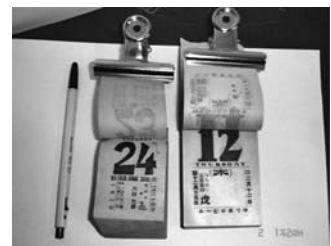
写真3 昭和6年(右)と皇紀2596年(左)の日めくり(日表)

元号と西暦の記載はあるが、皇紀と干支は載っていない。皇紀は2591年であり、干支は辛未の年にあたる。ただし、日にちには干支が用いられ、九星と六曜の配当がある。新暦と旧暦の日付が左右対称に配置されている。頒布しているのはサッポロビールであり、ひらがなとカタカナの表記がみられることから、朝鮮仕様とはかながえにくい。また、曜日を英語で表記しているので、「鬼畜米英」を合言葉に英語を駆逐した時代がまだ到来していないことも示している。