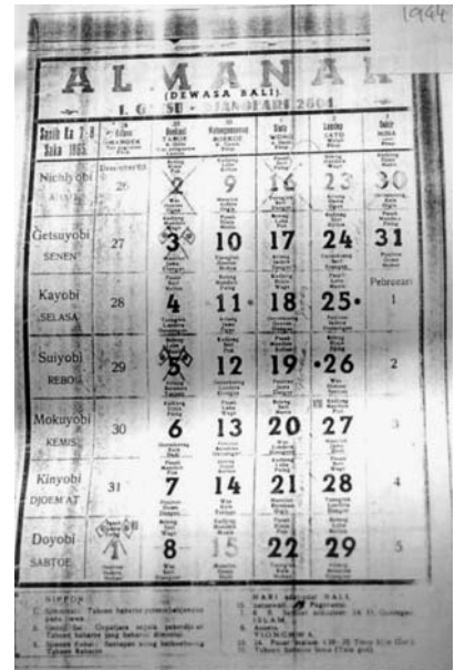
写真7 皇紀2604年のバリ・カレンダー

アルマナクの下にバリ時間とあるので、あわせてバリ暦と称してもかまわないであろう。12枚の月表から構成されていて、年には神武紀元=皇紀2604が表示され、1月が日本語とオランダ語で表記されている。サカ暦は西暦78年を紀元とするヒンドゥー暦であり、ヒンドゥー・バリとよばれるほどインドの影響をこうむった島であることがわかる。曜日は日本語のローマ字表記に加え、アラビア語系の単語が並んでいる。インドネシアの他島がイスラームの影響を強く受けていることの反映でもある。ただし、土曜日はポルトガル語系の単語である。最下部の欄外の左半分は NIPPON の項で、1月の年中行事=祝日として四方拝(歳旦祭)、元始祭、新年宴会が特記されている。その右半分にはバリ伝統行事の日、イスラームの行事、中国の行事がリストアップされている。