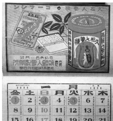
写真 1 1926 年の壁掛けカレンダー