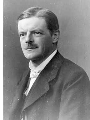
Abb. 6: Prof. Dr. Robert A. Fritzsche

Auf die kritischen Einwände reagierten die Einladenden mit Klarstellungen, die teilweise die Angemessenheit der Kritik bestätigten. So betonte Spira, er wäre „schärfster Gegner jedes Anarchismus“, doch müsse man den anarchistischen Zustand ganz begreifen, „um in den nachstaatlichen Zustand zu kommen“, der im Individuum beginne. Mit dieser Argumentation, mit der er sich in der Tradition des deutschen Idealismus, der „den Kampf mit den Staatstheorien aufgenommen“ habe, stehen sah, 44 wird Spira sich dem Kultusminister kaum als Weggefährten bei der Sicherung der Demokratie empfohlen haben.