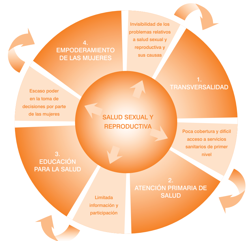
Gráfico 1. Limitaciones y estrategias de promoción de la salud sexual y reproductiva.