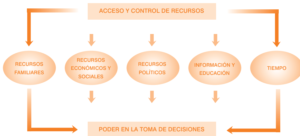
Gráfico 4. Relaciones entre acceso y control de recursos y poder en la toma de decisiones.

Por otra parte, debe potenciarse el acceso y control de los recursos educativos mediante formación dirigida específicamente a mujeres e involucrándolas en todo el proceso educativo. Por último, en cuanto a los recursos temporales, los servicios y programas de salud sexual y reproductiva han de potenciar que las mujeres destinen parte de su tiempo a su propio cuidado y al disfrute de su propia sexualidad.