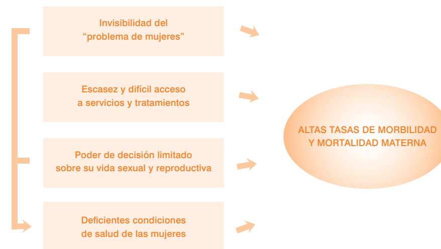
Gráfico 4. Causas de las altas tasas de morbilidad y mortalidad materna

que son frutos de su posición subordinada dentro de la sociedad (Antolín, 1997).