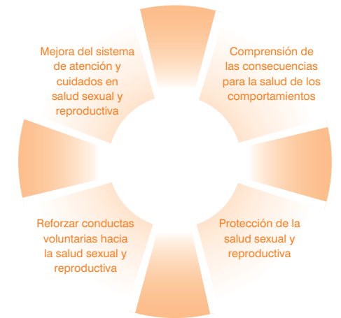
Gráfico 3. Actividades de educación para la salud en salud sexual y reproductiva

Fuente: Adaptación de L. Mazarrasa (2003).