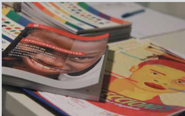
Mesa de materiales en el diálogo «Afro LGBTI», quizá el más potente de los debates, en el mes de julio.