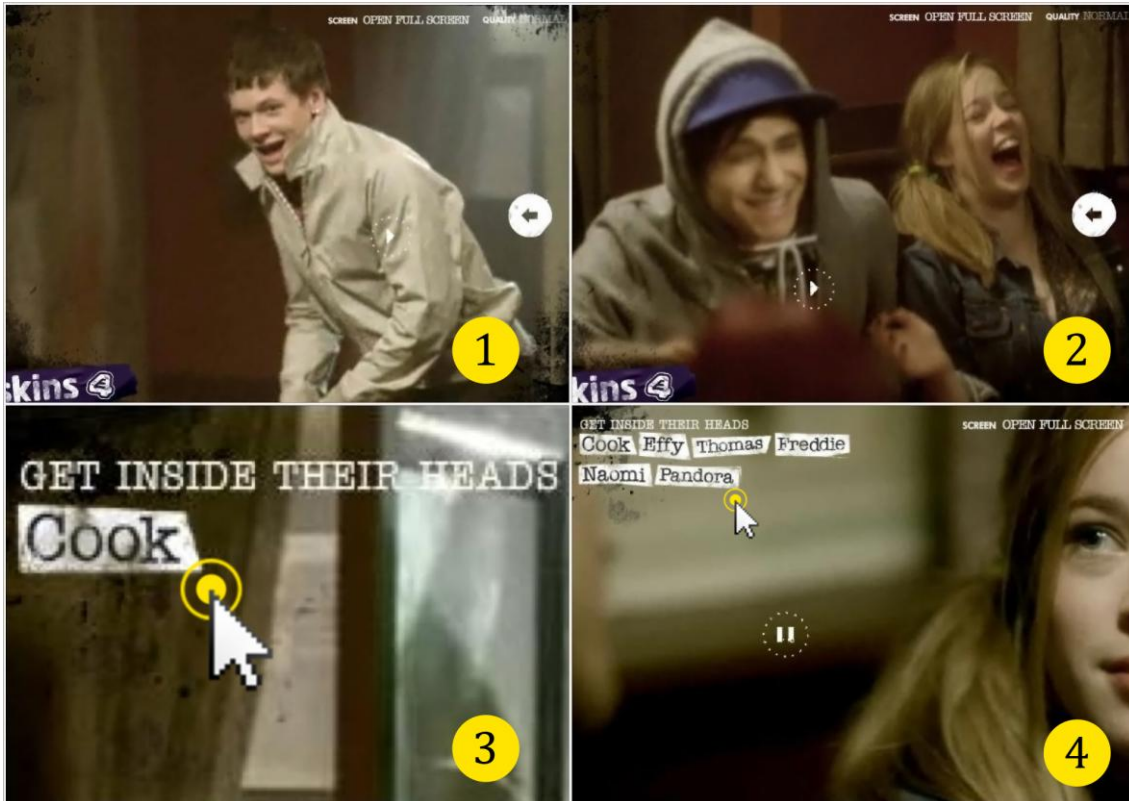
Imagen 2. Promo de la tercera temporada de Skins

bar (imagen 1 para Cook y 2 para Pandora). Cuando este segmento llega a su fin, la promo reanuda su reproducción.