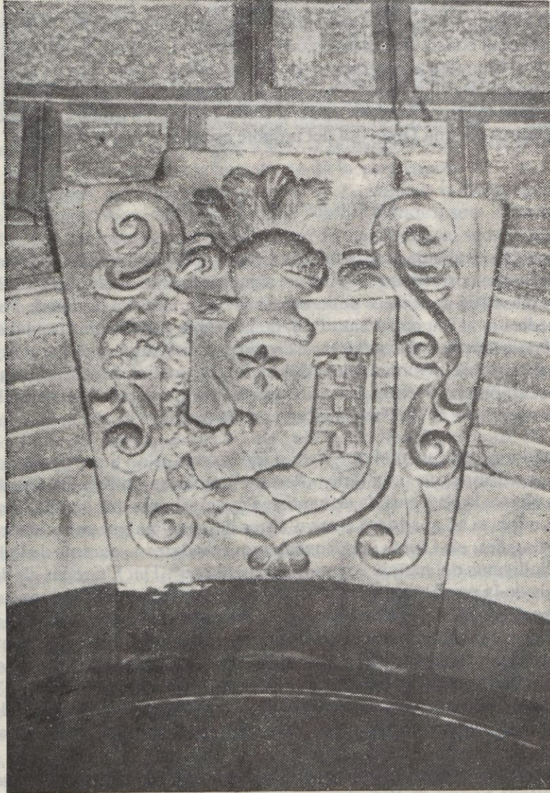
Escut Barnoya a la capella dels Dolors

grau nobiliari de cavaller del Principat de Catalunya (13) . Morí accidentalment a Caldes de Montbui, sense successió, però fou inhumat a Camprodon, al monestir de Sant Pere. Deixava importants llegats a la parròquia de la seva vila natal, entre d'altres, per a l'edificació de les capelles de Sant Pau i dels Dolors (14) .