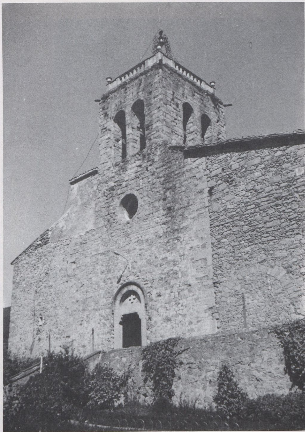
Façana de ponent i campanar. Segle XV (a excepció de les addicions laterals posteriors).