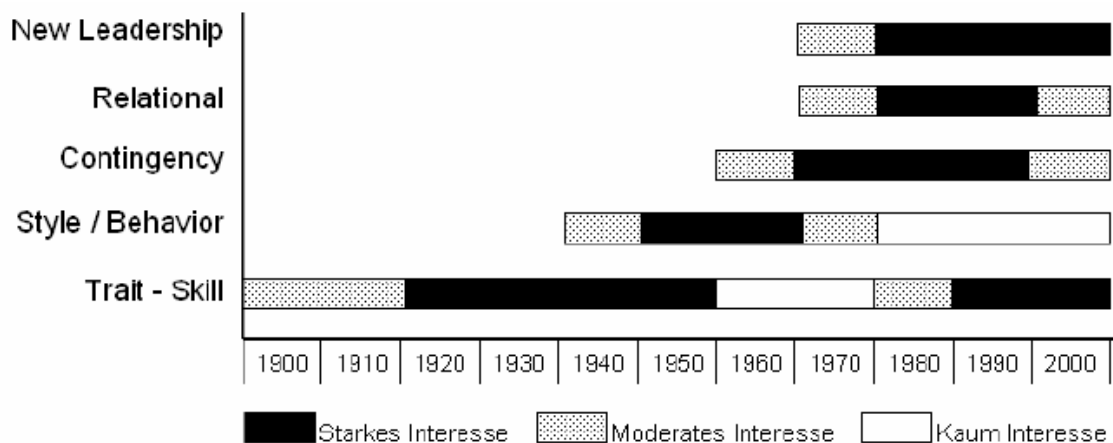
Abbildung 1: Entwicklung der Führungsforschung 80

Zur Einordnung der Transformationalen Führung in die Führungsforschung wird im Folgenden ein Überblick über die wichtigsten fünf Arten von Führungstheorien gegeben. Dabei handelt es sich um Eigenschaftstheorien, Verhaltenstheorien, Situative Theorien, Beziehungstheorien und New Leadership Theorien. Abbildung 1 zeigt die historische Entwicklung der verschiedenen Konzeptualisierungen und wieviel Interesse, ihnen von der Forschung zu verschiedenen Zeitpunkt gewidmet wurde.