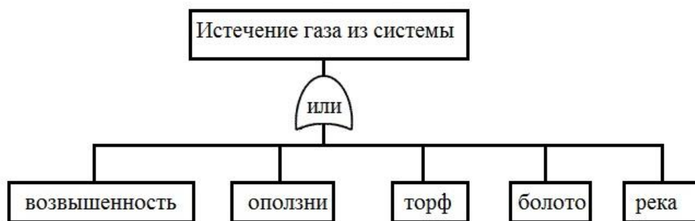
Рис. 2. Главное и индуцированные события дерева событий

Для оползневых участков M2 - 1,3 \cdot 10^{-2} \text{ год}^{-1} . Утечка на территории торфяных болот M3 - 1,2 \cdot 10^{-2} \text{ год}^{-1} , а для заболоченной местности M4 - 1,2 \cdot 10^{-2} \text{ год}^{-1} . Вероятность аварии на переходах газопровода русла реки M5 - 1,3 \cdot 10^{-2} \text{ год}^{-1} .