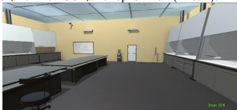
Рис. 1. Снимок экрана программы. Лаборатория

Рассмотрим пример реализации одной из работ по дисциплине «Общая энергетика» (Рис. 1).