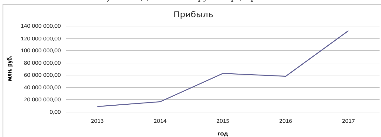
Рисунок 5 – Динамика изменения прибыли предприятия

Выполненный анализ показал, что наблюдается устойчивый рост выпуска продукции гражданского назначения, это связано с расширением номенклатуры выпускаемой продукции, что в свою очередь способствует росту выручки предприятия (рисунок 4) в связи с количеством рынков сбыта новой продукции.