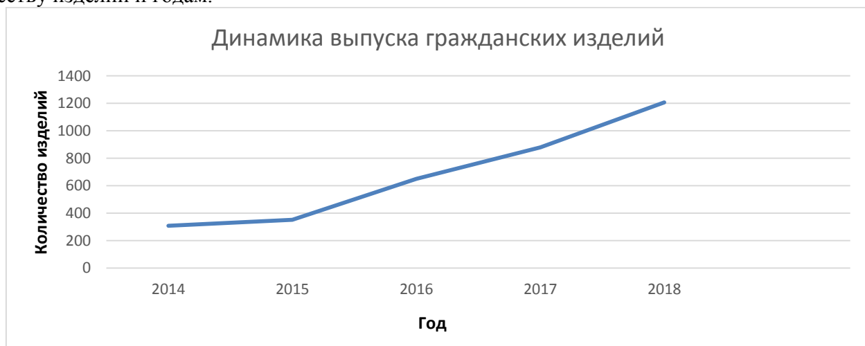
Рисунок 1 – Динамика выпуска гражданских изделий

На рисунке № 1 представлена динамика выпуска изделий гражданского назначения по количеству изделий и годам.