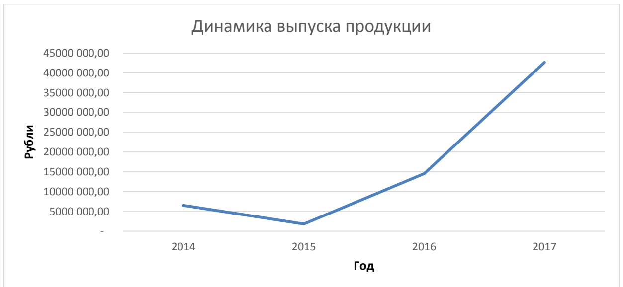
Рисунок 2 – Объем выпуска гражданских изделий

Сравнительная динамика показателя рентабельности производства продукции гражданской направленности представлена на рисунке 3.