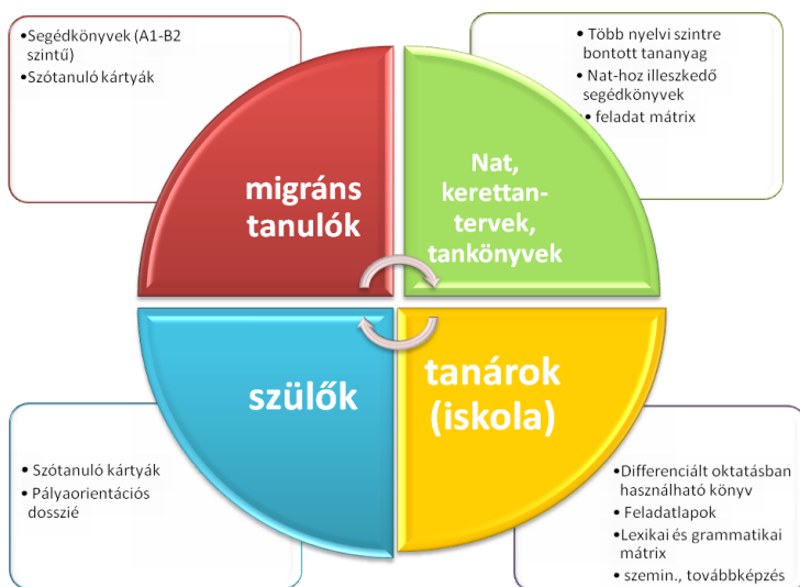
2. ábra: Az Együtthaladó projektek során kifejlesztett segédanyagok és taneszközök

jektek programmá épültek. A fejlesztés során a problématerképen rögzített valamennyi területen használható segédkönyvek, taneszközök készültek. A fejlesztők összetett problémaként kezelték a migráns tanulók oktatása során jelentkező kihívásokat, ezért minden érintett számára használható komplex taneszközcsaládot hoztak létre az évek során.