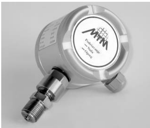
Slika 1 – Industrijski transmiter pritiska (proizvođač IHTM-CMTM)

Tabela 4, daje kratak opis oblika, dizajna, ukupne mase i materijala sklopa jednog industrijskog transmittera pritiska. Transmitteri konkurenata imaju lokalno očitavanje merene veličine putem LCD-a koji se nalazi u samom uređaju. Lokalni pokazivač je standardan i neodvojivi deo svakog transmittera, deo SMART elektronike. Dodatnim razvojem IHTM-ovih transmittera pritiska trebalo bi da se poveća konkurentnost na domaćem, ali i na stranom tržištu.