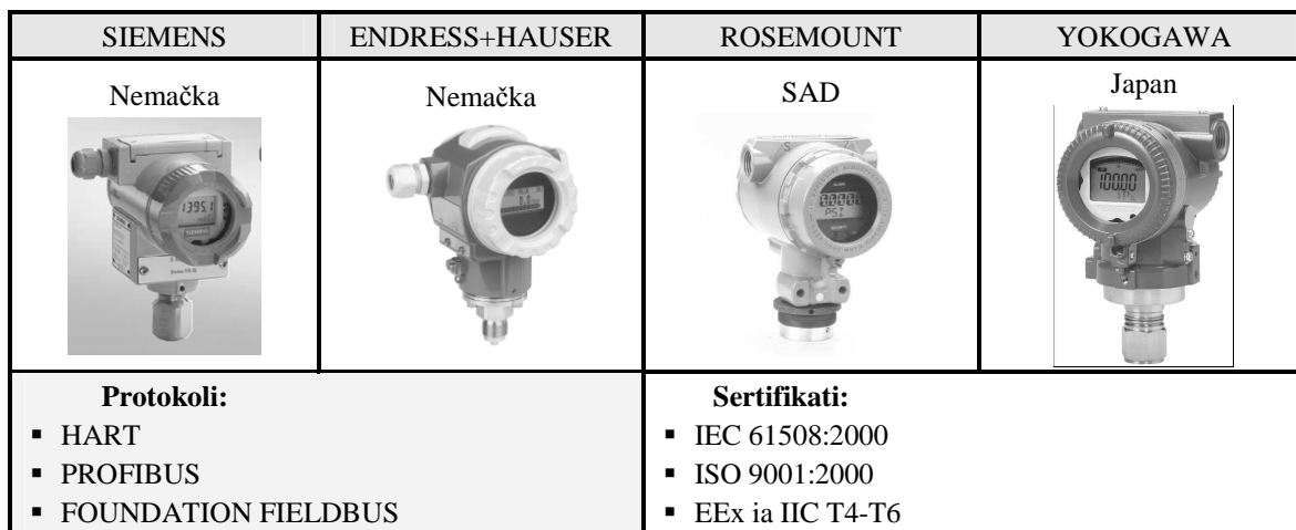
Tabela 3 – Transmiteri konkurenata na tržištu (peta tehnološka generacija)

Najzastupljeniji način prenosa mernih rezultata kod industrijskih transmitera je analogni strujni signal, čija je vrednost u opsegu od 4mA do 20 mA, pri čemu je zavisnost tog signala od vrednosti merene veličine linearna. Ovaj sistem je već decenijama industrijski standard. Stariji tipovi industrijskih transmitera pripadaju trećoj tehnološkoj generaciji senzora. Oni sadrže elektronski sklop (pojačavač) koji vrši analognu obradu signala, a na izlaznim priključcima daje standardni strujni signal (4mA do 20mA). Takvi transmiteri se i dalje proizvode i koriste u industriji, a ugrađuju se na merna mesta gde nisu potrebne visoke performanse.