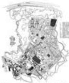
Слика: Јосимовић, Ј. 1867. Објасњење регулације београдске вароши. Београд: Ј. Јосимовић, 1867.