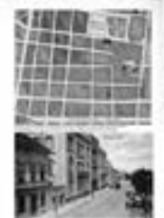
Слика: Јосимовић, Ј. 1867. Објасњење регулације београдске вароши. Београд: Ј. Јосимовић, 1867.