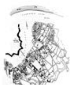
Слика: Јосимовић, Ј. 1867. Објасњење регулације београдске вароши. Београд: Ј. Јосимовић, 1867.