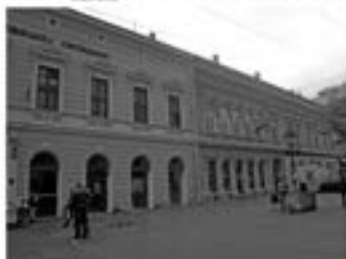
Слика: Јосимовић, Ј. 1867. Објасњење регулације београдске вароши. Београд: Ј. Јосимовић, 1867.

Јосимовић је предложио да се варош регулиса у шанцу, што је значило да се варош изгради у облику шанца, односно да се варош изгради у облику правоугаоника са правоугаоним улицама.