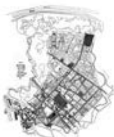
Слика: Јосимовић, Ј. 1867. Објасњење регулације београдске вароши. Београд: Ј. Јосимовић, 1867.

Јосимовић је предложио да се варош регулиса у шанцу, што је значило да се варош изгради у облику шанца, односно да се варош изгради у облику правоугаоника са правоугаоним улицама.