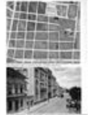
1867. Josip Jovanović, 'Објашњење плана за уређење Београда' (Explanation of the plan for the regulation of Belgrade).