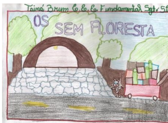
ANEXO 6 - Desenhos relacionados ao filme Wall-E