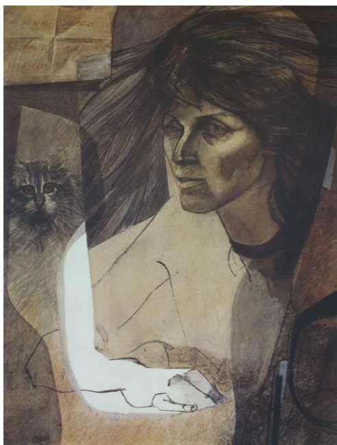
Figura 1. La mujer y el gato (1978), Osvaldo Attila

La coherencia entre la práctica artística y docente se anuda en torno a cómo la reflexión las atraviesa y produce un decir que da cuenta de un hacer. La enseñanza de Osvaldo Attila es un testimonio de esa trama. Será difícil pensarla por fuera de aquello que me permite establecer las diferencias que bien o mal me constituyen. Lectura interesada, que no puede concebirse sin la amistad, que lejos de ser un ingrediente más, la funda. El concepto clave en su obra y su enseñanza fue el valor [Figura 1].