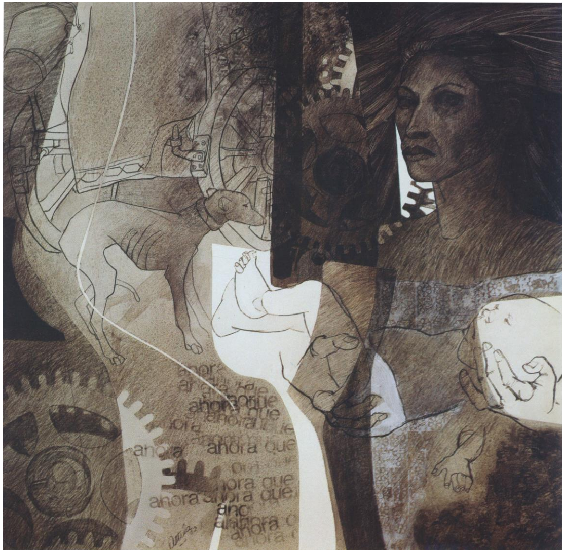
Figura 3. ¿Y ahora qué? (1982), Osvaldo Attila

La dialéctica es insuficiente aquí porque explica siempre un movimiento, una especie de tensión compensada, que viaja al equilibrio. Nos ayuda a anticipar el devenir, pero desde un virtual punto fijo, que a la postre también está implicado en ese movimiento [Figura 3].