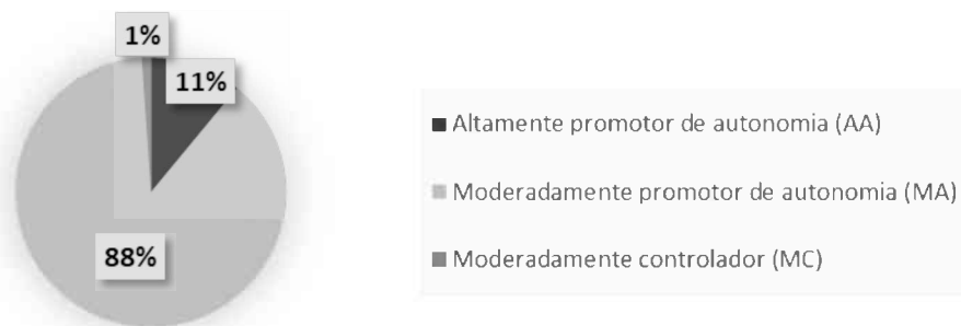
FIGURA 1- Desempenho por respondente obtido pela ponderação dos escores médios em cada uma das subescalas.

A pesquisa verificou também o desempenho de cada participante por meio das médias das oito respostas, adotando a ponderação dos escores médios em cada uma das quatro subescalas. A Figura 1 apresenta o desempenho dos respondentes.