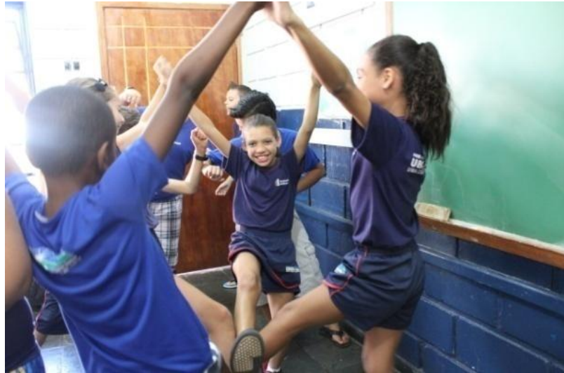
Fotografia 5 – Estátuas humanas coletivas

Uberlândia, junho de 2015.