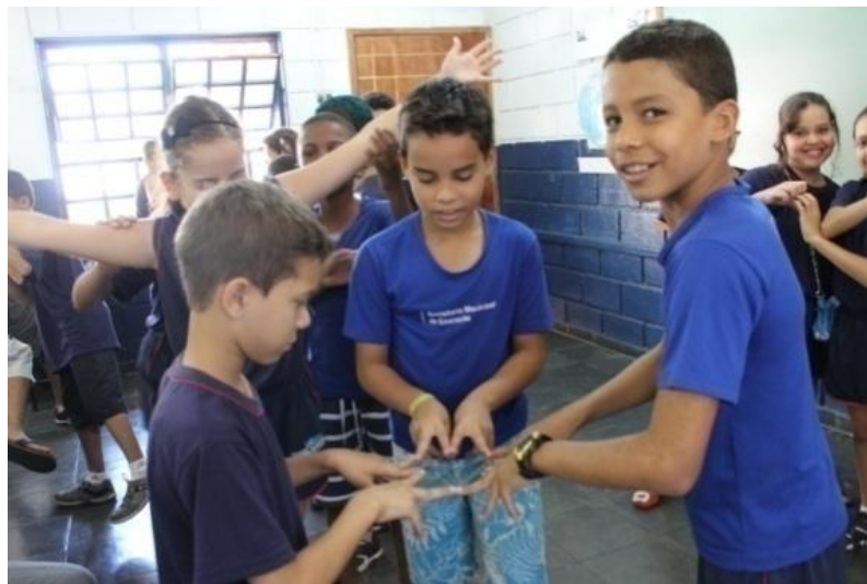
Fotografia 4 – Estátuas humanas coletivas

Uberlândia, junho de 2015