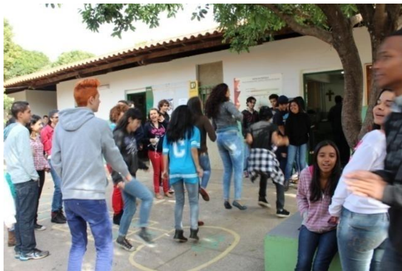
Fotografia 12 – Alunos do 3º C em ação performativa: "Brincadeiras infantis"

Uberlândia, junho de 2015