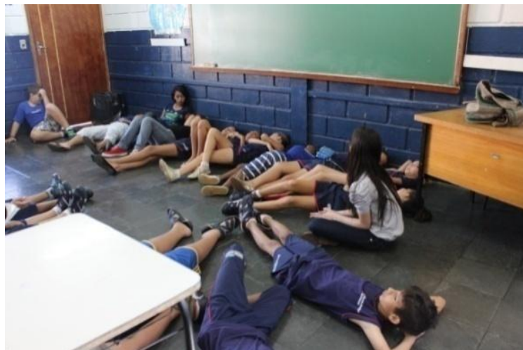
Fotografia 2 - Momento de Relaxamento

Uberlândia, abril de 2015