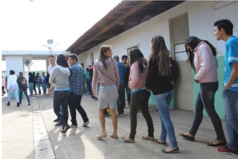
Fotografia 13 – Alunos do 3º B em ação performativa: "Sombras"

Uberlândia, junho de 2015