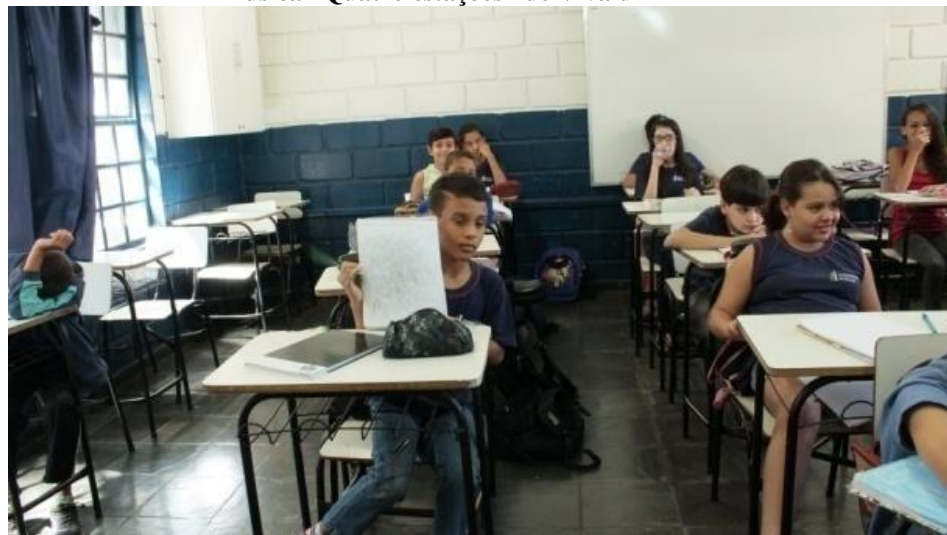
Fotografia 7 – Exercício de movimento corporal paralelo ao registro em formas de linhas da música “Quatro estações” de Vivaldi

Uberlândia, agosto de 2015