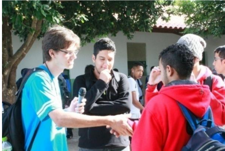
Fotografia 15 - Alunos 3º A e B em ação performativa: "A entrevista"

Uberlândia, julho de 2015