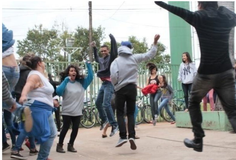
Fotografia 18 - detalhe fig. 10

Uberlândia, julho de 2015