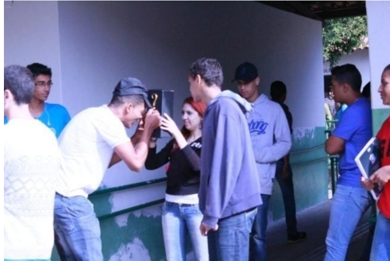
Fotografia 9 – Alunos do 3º E em ação performativa: "O que tem na caixa?"

Fonte: Autoria própria. Uberlândia, junho de 2015