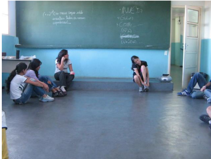
Fotografia 1 – Aula de teatro em um colégio particular

Uberlândia, 2003