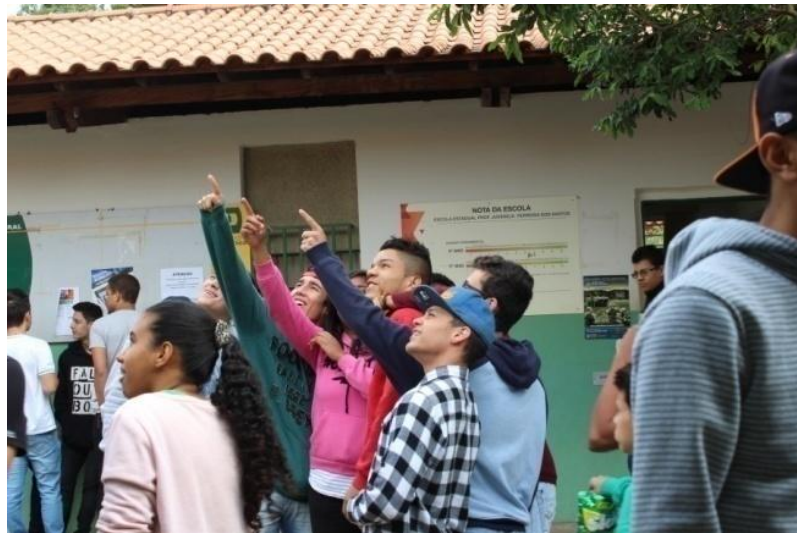
Fotografia 10 – Alunos em ação performativa: "O que tem lá em cima?"

Uberlândia, junho de 2015.