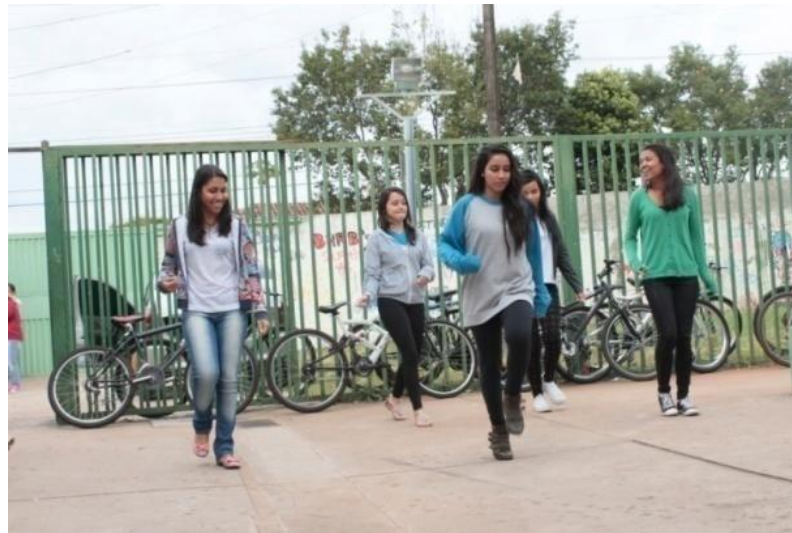
Fotografia 17 – Alunos do 3º A em ação performativa: "Intervenção - dança muito louca"

Fonte: Aatoria própria. Uberlândia, julho de 2015