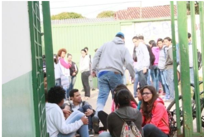
Fotografia 16 - Alunos do 3ºB em ação performativas: "Atrapalhando a passagem"

Uberlândia, julho de 2015