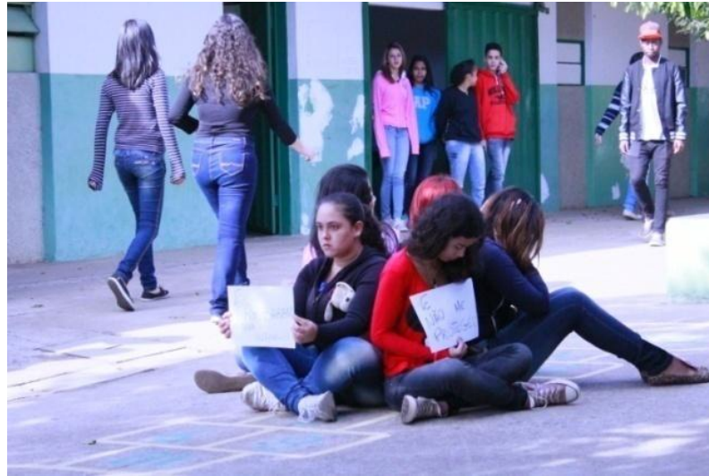
Fotografia 8 – Alunas do 3ºE em ação performativa: "Cadê a liberdade de Expressão?"

Uberlândia, junho de 2015.