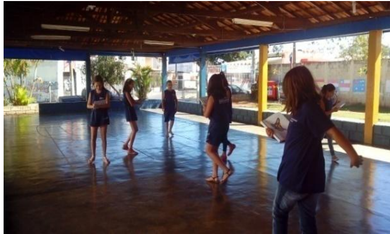
Fotografia 6 – Exercício corporal a partir de registro gráfico de memórias

Uberlândia, agosto de 2015