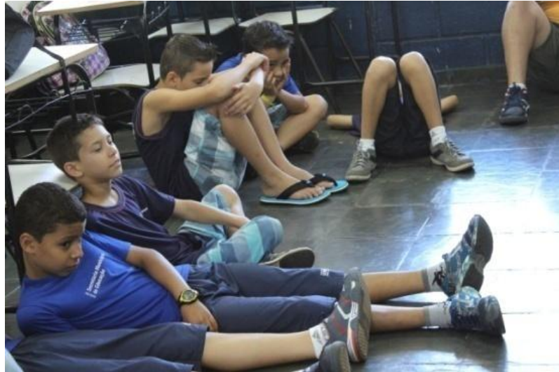
Fotografia 3 - Momento de ouvir os alunos

Uberlândia, abril de 2015