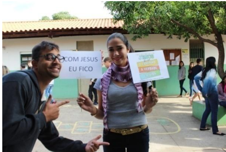
Fotografia 14 – Aluna do 3º B em ação performativa: "Evangélizar sem argumentos"

Fonte: Autoria própria. Uberlândia, junho de 2015