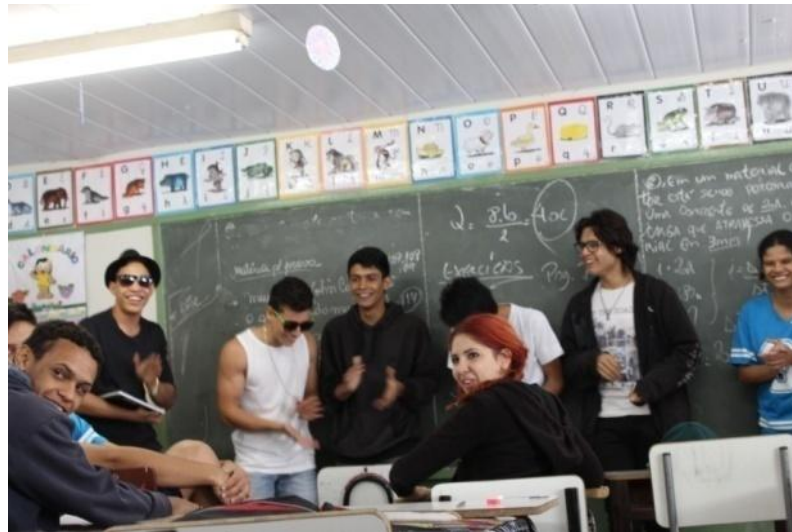
Fotografia 11 – Alunos do 3ºB em ação performativa: "O pagode da ofensa"

Uberlândia, junho de 2015.