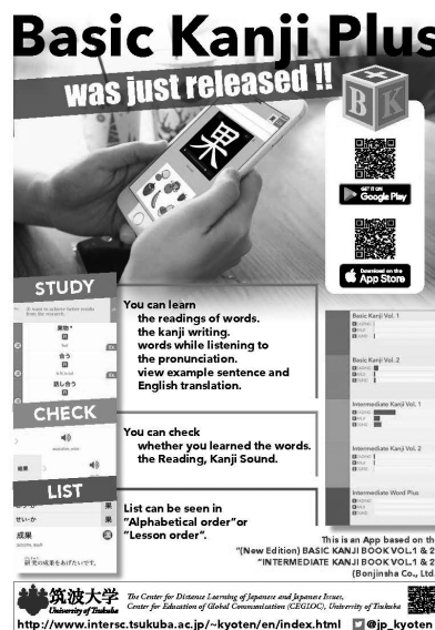
図1 Basic Kanji Plusのフライヤー

Basic Kanji Plusは筑波大学の留学生センター（当時）の実践から開発された『BASIC KANJI BOOK』Vol.1、Vol.2、『INTERMEDIATE KANJI BOOK』Vol.1、Vol.2を漢字学習アプリとしたものである。Android版の制作は2016年から行っており、すでに伊藤・今井（2018）でも2017年6月に一般公開をしたことを報告している。その後も順調に利用者は増えており、2018年9月末現在で総インストール数は約2,050インストールとなっている。そして、2017年のAndroid版公開時より要望のあったiOS版の制作をAndroid版の公開に引き続き行い、Basic Kanji Plus iOS版を2018年2月に一般公開した。2018年9月末現在、iOS版の総インストール数は約630インストールとなっている。