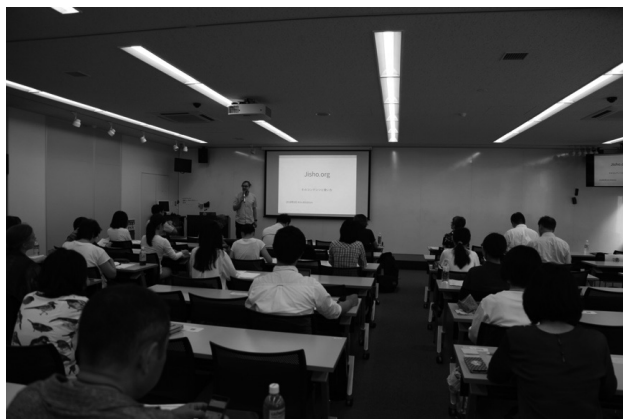
図5 「WEB ツールを活用した語彙学習」のフライヤーと当日の様子