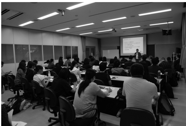
図7 「日本語教育の多様性」のフライヤーと当日の様子

当日は53名の参加があり、終了後のアンケートではほぼ全員から「面白かった」「役に立った」という感想が寄せられたことに加え、「今後は移民児童への教育などについても知りたい」など本講演からさらに広げた話題についても興味・関心を持った様子が見え、感想が寄せられた。