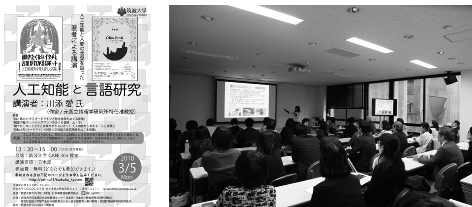
図3 「人工知能と言語研究」のフライヤーと当日の様子

当日は57名の参加者があり、AIについての基礎的な知識から言語研究についての関わりについて話があった。特に後半部分では、今後、高性能な機械翻訳も出てくるのが予想されるが、文化背景が異なるとその解釈も異なる事例を踏まえながら、語学教育の目的は単にその言語を話せるようにすることではなく、「人をどのように育てるべきか」という視点は人間にしか持ちえない、と語学教育の必要性についても触れた。