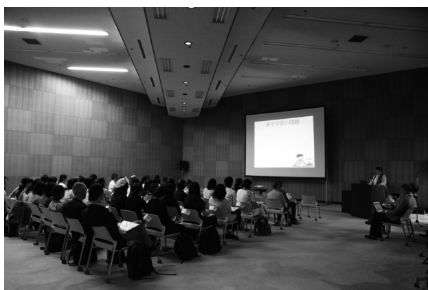
図6 「e-learning での漢字学習の可能性」のフライヤーと当日の様子