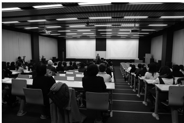
図4 「型をマスターして、型破りになろう」のフライヤーと当日の様子