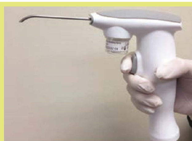
2. ábra: a True Definition szkennert használt poradagoló 8