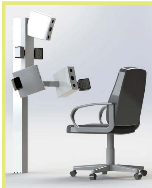
4. ábra: Arc-szkennert (Facial Insight 3D™ Scanner ) 3

A háromdimenziós modellezésnek és szkennelésnek alapjait a francia festő, szobrász és fotós Francois Willème fektette le 1860-ban, aki a tárgyakat és személyeket 24 szögből fényképezte, majd a képek segítségével hozta létre a modellek 3D-s mását. 1 Bő 150 év elteltével napjainkban a háromdimenziós számítógépes grafikában a 3D modellezés az a folyamat, amely matematikailag ábrázol tetszőleges háromdimenziós objektumokat. 2