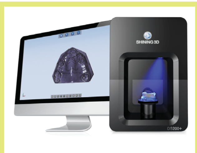
1. ábra: Autoscan-DS200+ dental 3D szkennert