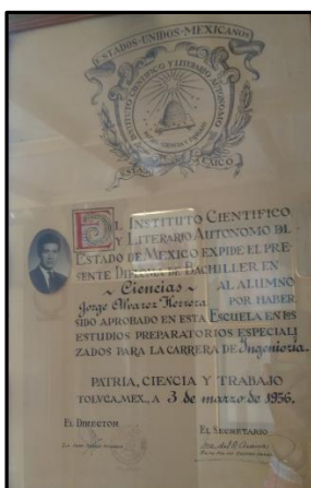
Diploma de Bachiller en Ciencias expedido por el ICLA, 3 de marzo de 1956. Estudios Preparatorios Especializados en la Carrera de Ingeniería.