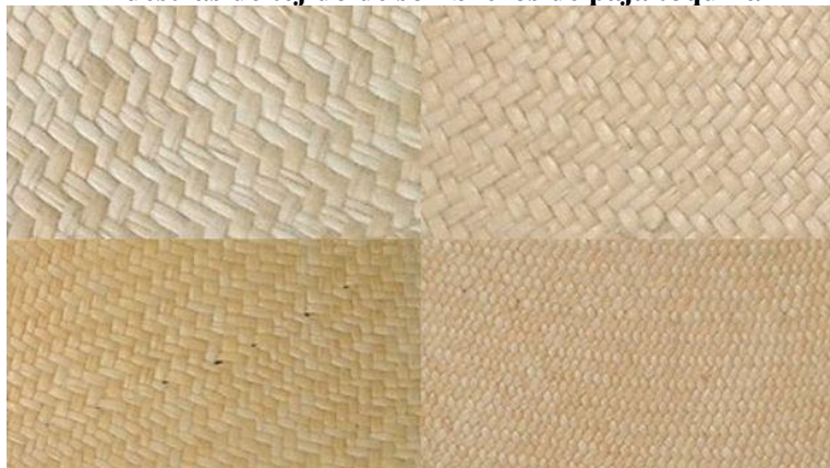
Gráfico 2 Muestras de tejido de sombreros de paja toquilla