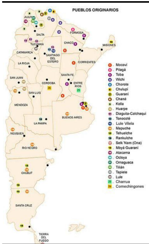
Figura 2. Mapa de Argentina con los Pueblos Originarios (según Instituto Nacional de Asuntos Indígenas).