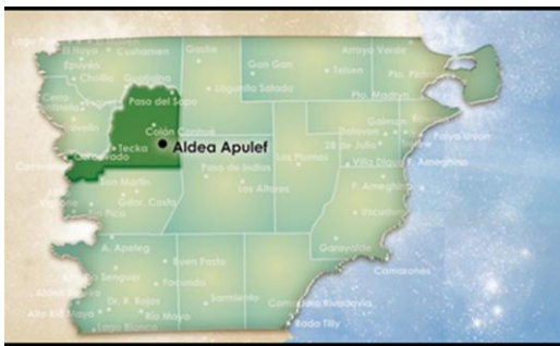
Figura 3. Mapa de la provincia de Chubut, en la Patagonia, y localización de la Aldea Epulef, perteneciente a la Comunidad Mariano Epulef.

El trabajo con la comunidad implicó “estar allí”, y en diferentes ocasiones. Desde el año 2009 hasta el 2012 se realizaron cinco estancias en campo con un total de 75 días viviendo en la comunidad en casas de familias. Se hicieron 90 entrevistas y conversaciones informales tanto individuales como grupales, entrevistando o conversando con 133 personas. A su vez se desarrollaron reuniones grupales e institucionales, coordinación de talleres y observación participante tanto de las actividades de la vida diaria como de las ceremonias y festejos de la comunidad.