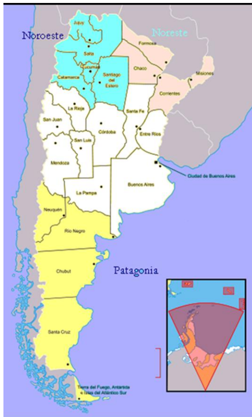
Figura 1. Mapa de Argentina con la región Patagonia y el Noroeste y Noreste.

El presente texto estará dividido en tres apartados. El primero, sintetiza la situación general de Pueblos Originarios en el país, centrándonos en los casos que tomaron estado público en los últimos años y que aún continúan con sus demandas. En un segundo apartado describiremos el acercamiento que hizo la Psicología, o psicólogos y psicólogas, a las situaciones y problemáticas indígenas, dando cuenta de un espacio vacío y poco estudiado en el caso de Argentina. Luego, contribuiremos con un estudio en curso desde la Psicología Social en una comunidad mapuche, compartiendo los temas y ejes de análisis que venimos desarrollando. Repensando este desafío desde sesgos normativizantes y de intensión clasificatoria, presentamos un tercer apartado a modo de reflexiones finales. Allí ponemos en consideración los riesgos posibles en la medida que la Psicología se acerque de modos no reflexivos y sin vocación de intersubjetividad a las problemáticas a los Pueblos Originarios.