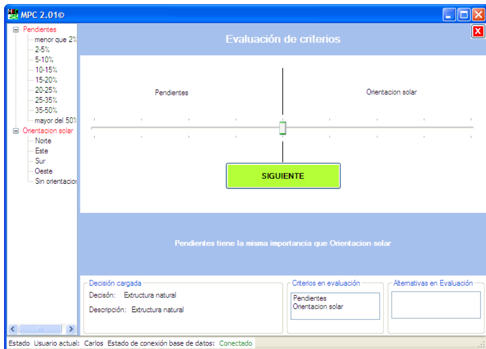
Figura 1. Pantalla de captura de juicios de expertos del MPC® 2.0 (Pérez-Rodríguez y Rojo-Alboreca, 2012).