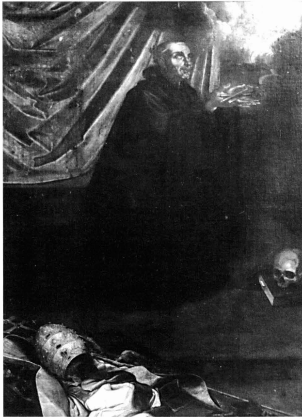
Fig.1. Francisco Pacheco, San Gregorio Magno en meditación , colección particular, Madrid

dos libros, una calavera y un azote penitencial. El primer término izquierdo está ocupado por una tiara papal y una cruz pontifical con triple travesaño depositadas sobre una vistosa capa pluvial y un paño blanco, seguramente un alba. Un peldaño separa el lugar donde reposan estos objetos y el estrado en donde ora San Gregorio. En la parte derecha de ese peldaño puede apreciarse con claridad la firma latinizada del pintor: Fran.cus Paciec[us] , cuyas dos últimas letras no son visibles porque el marco actual las oculta.