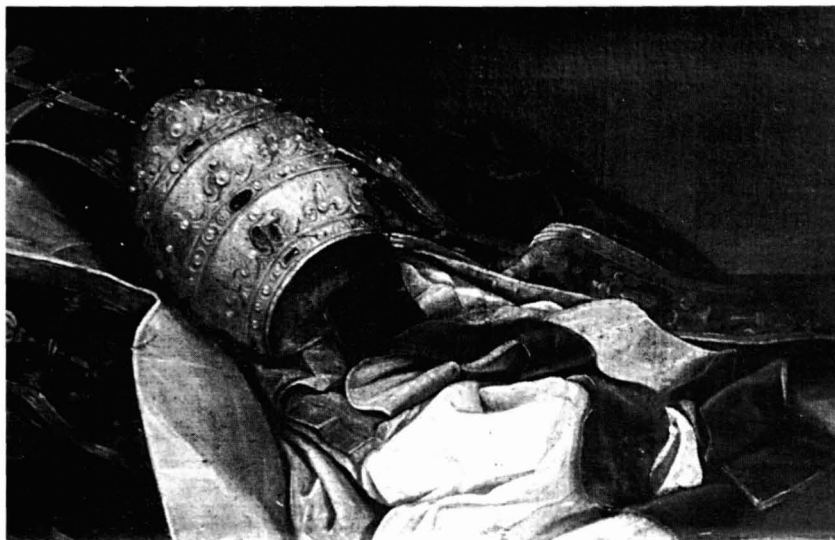
Fig. 2. F. Pacheco, San Gregorio Magno en meditación . Detalle.

singular, la tiara están dibujados con gran detenimiento y pulcritud. En definitiva, nada nuevo nos descubre esta obra sobre las habilidades del modesto pintor Pacheco. Una vez más es el tema, la iconografía, lo que más puede interesarnos, pues parece que nos encontramos frente a un caso de relativo protagonismo de la Inventio .