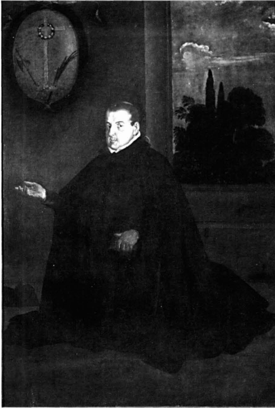
Fig. 3. Diego Velázquez, Don Cristóbal Suárez de Ribera , Museo de Bellas Artes de Sevilla.

telas encargadas a Carle Van Loo, en 1762, para decorar la capilla de San Gregorio en la iglesia de los Inválidos de París 5 . Por razones diversas y evidentes, no parece lógico suponer ningún tipo de relación entre los ejemplos citados y la tela de Pacheco, de la que además y por desgracia desconocemos su historia y procedencia.