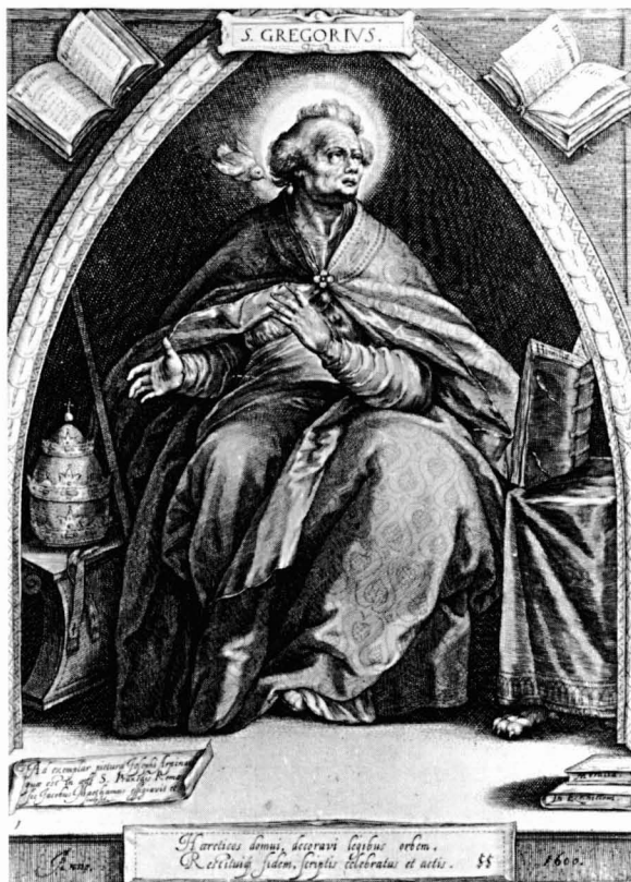
Fig. 4. Jacob Mathan, San Gregorio , grabado de 1602 a partir de un modelo de Giuseppe Cesari, Cavalier d'Arpino.

Con todas las reservas propias de este tipo de afirmaciones, creemos que el pintor andaluz en su creación partió sustancialmente del texto literario de Ribadeneyra que hemos aducido, y que por tanto el mayor mérito de la obra es su carácter de relativa invención 7 . Este valor novedoso en lo compositivo-temático no debió pasar desapercibido a otros maestros de la pintura sevillana. Al menos es clara su influencia en dos casos concretos. Los símbolos propios de la dignidad Papal del primer término (fig. 2), dispuestos en relativo desorden, configuran una especie de Vanitas , un fuerte motivo plástico y cromático que no podemos dejar de relacionar con el famosísimo cuadro de Valdés Leal, In ictu oculi , del Hospital de la Caridad de Sevilla, donde estos atributos pontificales también aparecen junto con otros emblemas de la vanidad de todos los honores y poderes mundanos.