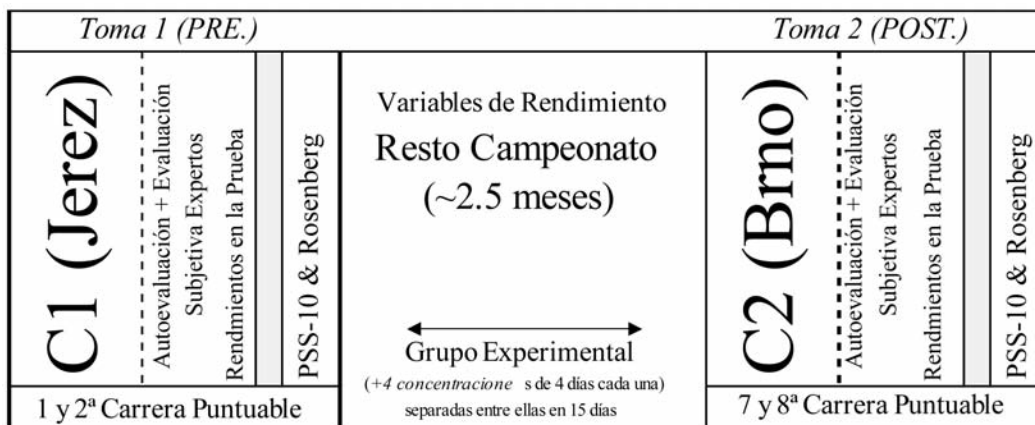
Figura 1. Protocolo experimental.

días consecutivos las dos últimas pruebas puntuables, séptima y octava (únicos circuitos donde se dobla la competición en el campeonato). Ambos circuitos son pistas homologadas de máximo nivel, sedes anuales de los Campeonatos del Mundo de Motociclismo de la Federación Internacional de Motociclismo (FIM).