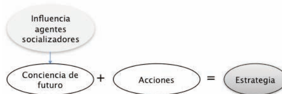
Figura 3. Elementos de la estrategia, elaboración propia.

Se deben desarrollar programas adaptados a los dos principales perfiles identificados. Programas para el colectivo de deportistas con conciencia de futuro, tales como el programa Tutoresport 2 que ya se viene desarrollando; pero también programas para el colectivo de deportistas sin conciencia de futuro. Respecto a estos últimos, algunos ejemplos: fomentar charlas con deportistas retirados que les sensibilicen sobre la importancia de desarrollarse a nivel académico y vocacional al mismo tiempo que su carrera deportiva; incorporar programas dirigidos a los agentes socializadores para que reciban cursos de sensibilización y entiendan que el asesoramiento vocacional y laboral de deportistas es un área muy importante que contribuye a su bienestar global durante su carrera deportiva y una vez terminada ésta y, en consecuencia, ayuda también a mejorar su rendimiento deportivo (Torregrosa, Sánchez, et al. 2004). Estos programas deberán desarrollarse en todas las etapas de la carrera deportiva (iniciación, desarrollo, perfeccionamiento, retirada y reubicación).