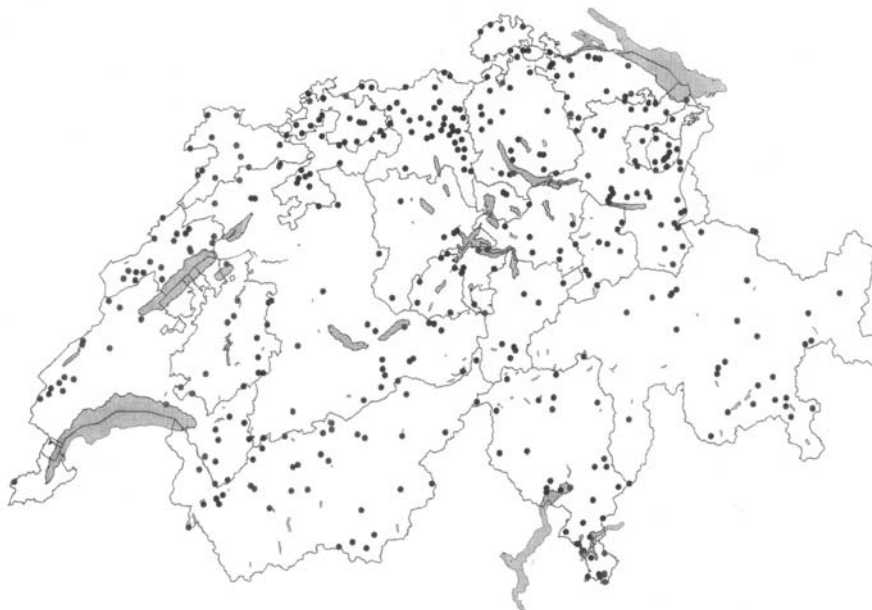
Fig. 1: Geotope von Nationaler Bedeutung im Inventar 1999.

1995: Die Arbeitsgruppe veröffentlicht einen nationalen Strategiebericht (Strasser et al. 1995), in dem der aktuelle Stand beschrieben wird und Lösungen aufgezeigt werden, wie die Lücken im Geotopschutz aufgearbeitet werden können.