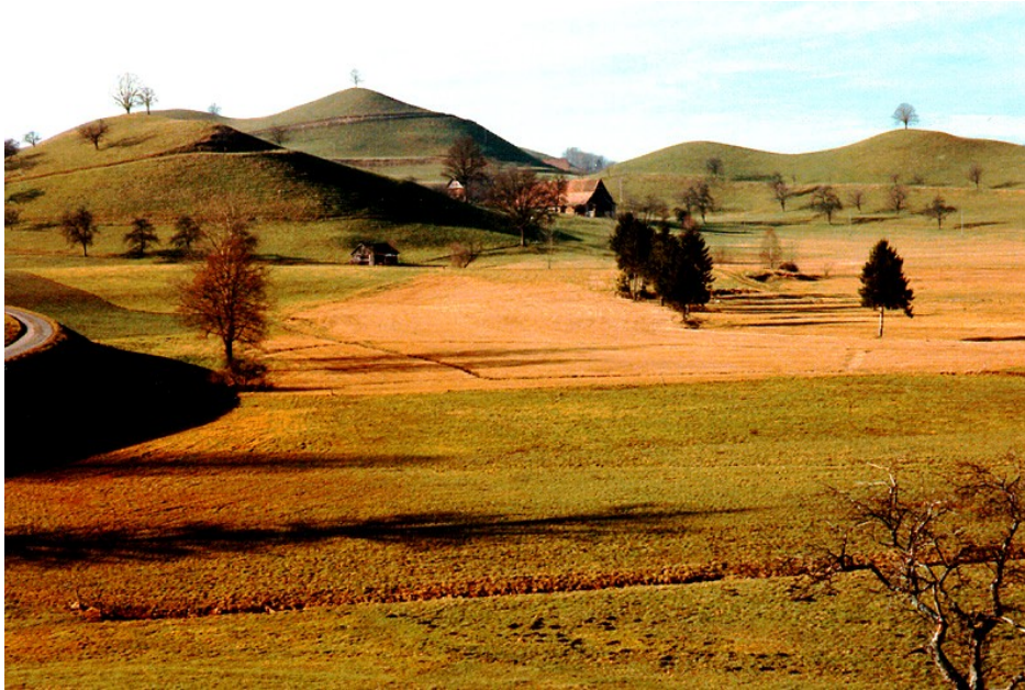
Fig. 5: Glaziallandschaft Menzingen – Neuheim; BLN- Objekt 1301, in Revision.

geologisch/geomorphologischen Aspekte aufgewertet werden und andererseits geprüft wird, inwieweit Geotope aus dem Geotopinventar 1999 ins BLN-Inventar aufgenommen werden können (Fig. 5).