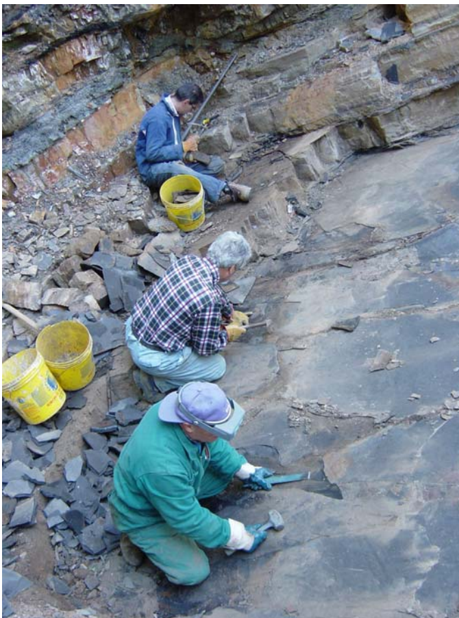
Fig. 2: Monte San Giorgio Heritage Site: Grabung des Naturhistorischen Museum von Milano (Italien) bei der Lokalität Sasso Caldo.

2001/2005: Drei Gebiete wurden für die UNESCO World Heritage List vorgeschlagen: 2001 konnte die Jungfrau-Aletsch-Bietschhorn-Region mit dem grössten Gletscher der Alpen, 2003 das Gebiet des Monte San Giorgio mit seinen berühmten Fossilagerstätten (Trias-Saurier) in die Liste aufgenommen werden (Fig. 2). Der Vorschlag für die Glarner Hauptüberschiebung, eine der am besten in Erscheinung tretenden Überschiebungen der Welt, ist noch in Bearbeitung.