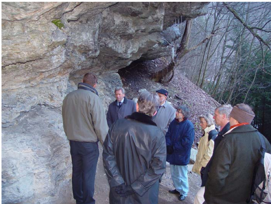
Fig. 4: Geopark Sarganserland-Walensee-Glarnerland: Glarner Hauptüberschiebung an der Lochsite; BLN-Objekt 1611 (Foto Geopark SWG).

Gegenwärtig sind fünf weitere Geoparks in Planung (Fig. 3):