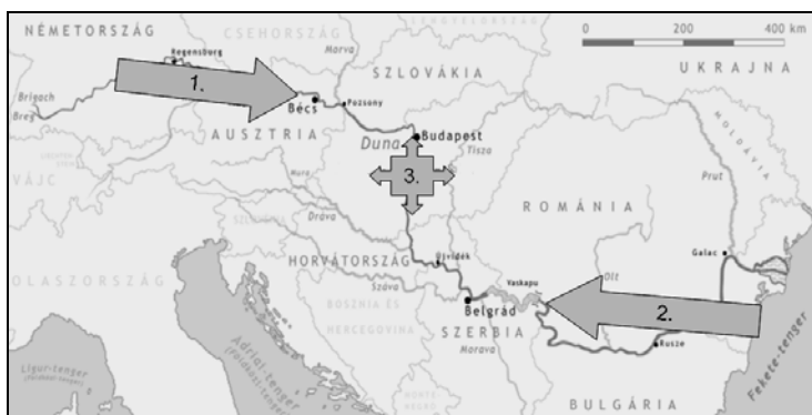
1. ábra. A magyarországi Duna-szakaszon leírt idegenhonos halfajok megjelenésének irányai

1: Felső-dunai vízgyűjtő, 2: Al-Duna, 3: hazai szakasz