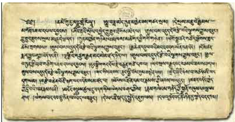
2. ábra Csoma-gyűjtemény, No. 3. „A (különböző) filozófiai rendszerek tengerére szálló hajó – kérdések és feleletek”, fol. 1.

Természetesen a 21. században a Keleti Gyűjtemény is él a technika adta lehetőségekkel, hogy a kéziratok és könyvritkaságok ne csak egy szűk csoport által legyenek a gyűjteményen belül kutathatók, hanem a világ bármely részén, s egyben a legszélesebb olvasóközönség rendelkezésére is álljanak, hogy ezáltal bővíthessék ismereteiket, vagy pusztán gyönyörködjenek bennük. E cél elérése érdekében tematikus digitális gyűjtemények készültek, amelyek a képanyag mellett több nyelven tartalmaznak szakértők által készített, megfelelő mélységű tanulmányokat.