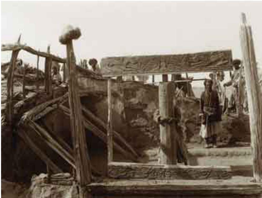
5. ábra Stein Aurél belső-ázsiai ásatása, Nija, házrom fafaragványokkal, 3. század. Cat. Stein LHAS Photo 37/3(13)

Részen a digitalizált tartalomszolgáltatás iránti igény kielégítése, másrészt azonban egy mélyebb katalogizálási törekvés jelenik meg azokban az elnyert pályázatokban, amelyek révén megtörtént a teljes arab kéziratok állomány ALEPH rendszerben történő feldolgozása (7. ábra). E munka során, Magyarországon első ízben valósult meg arab írásos tartalom bevitele. Hasonló módon válik elérhetővé ez év folyamán Goldziher Ignác levelezése. Mindkét esetben az egyes tételek leírásához digitalizált oldalak tartoznak.