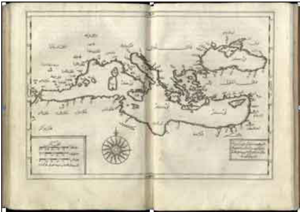
4. ábra A Földközi-tenger vidéke. Kâtib Çelebi, Tuhfet ül-kibâr fi esfâr ül-bihâr, 1141 [1729], KGY 768.409,71v-72r