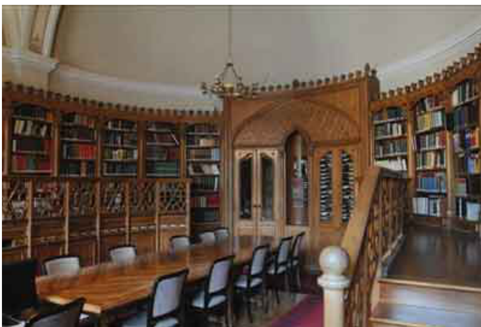
1. ábra A Keleti Gyűjtemény olvasóterme

Az elmúlt hat évtized alatt a könyvtár külön-gyűjteményeként működő osztály feladatköre és olvasói tábora is megváltozott. Létrehozásakor még egy szűk kutatói réteg kiszolgálása volt a feladata, s egyben kötetlen fórumot biztosított az orientalisztikai műhelymunka számára. Az Akadémiai Könyvtár országos szakkönyvtárrá válása a Keleti Gyűjtemény vonatkozásában is új helyzetet teremtett. Ma a legtöbb olvasó a felsőoktatási intézmények hallgatóiból kerül ki, akik számára a gyűjteményben dolgozó keleti szakos diplomával rendelkező könyvtárosok nyújtanak szakirodalmi tájékoztatást.