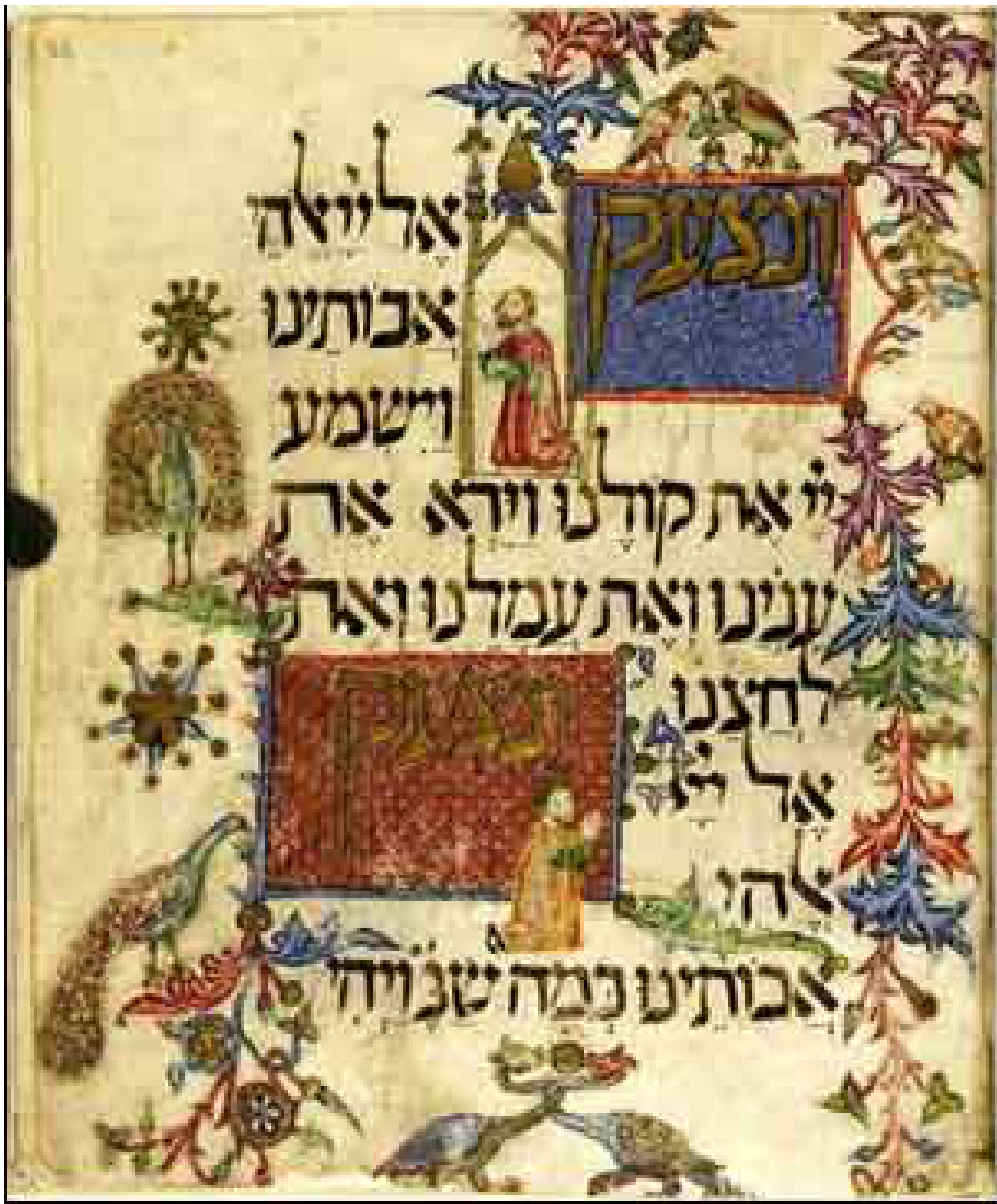
3. ábra Kaufmann Haggáda, Katalónia, 14. sz., MS A 422, fol. 26r