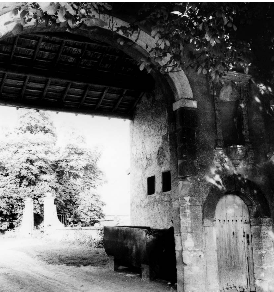
Fig. 3 Entrée de l'abbaye, vue du grand portail et de la porte piétonne.

L'église ne paraît pas avoir été détruite mais les granges qui l'entouraient ont été brûlées, de même, semble-t-il, que la plus grande partie du logis que ce remarquable abbé s'empresse de rétablir (12), les travaux se poursuivant plusieurs années (13). Cet effort matériel est bientôt suivi d'une restauration spirituelle et intellectuelle de l'abbaye qui adhère, dès 1614, à la Réforme de « l'Antique Rigueur » menée par Servais de Lairuelz (1560-1631) au sein de l'ordre prémontré, depuis l'abbaye lorraine de Sainte-Marie-Majeure (Pont-à-Mousson). En 1635, le frère de Servais, Jean de Lairuelz, favorise spécialement Salival par un legs de 11 000 livres destinées à accélérer les travaux qui sont loin d'être achevés, illustrant la réputation « de sauveur d'abbayes » du réformateur (14).