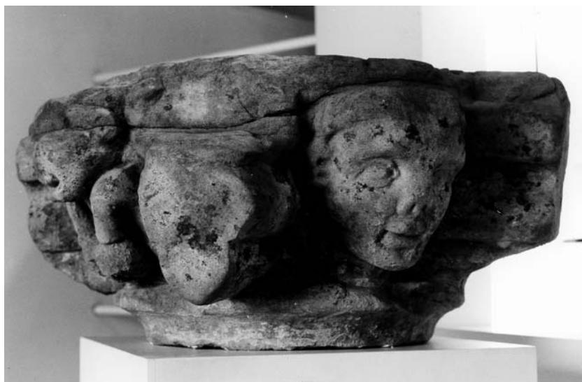
Fig. 2 Clef de voûte provenant de l'église.

À cette époque, Jacques de Lorraine (1239-1260) évoque un établissement déjà important, « aux innombrables bâtiments de construction somptueuse » (7).