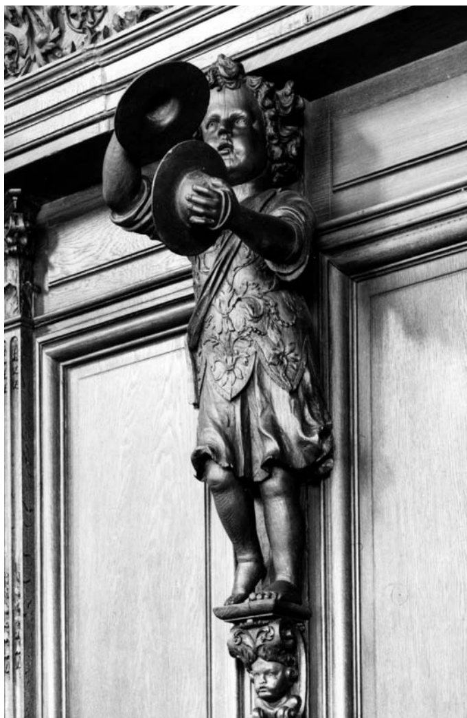
Fig. 6 Les lambris du chœur des chanoines (1695) remontés vers 1819 dans la chapelle des Cordeliers à Nancy, détail (Musée Historique Lorrain).

La dernière campagne de travaux, initiée par l'abbé Jean Jacquot (1753-1777) à partir de 1764, semble se poursuivre jusque vers 1780, les derniers paiements étant enregistrés en 1781. Bien documentée, grâce au devis de 1770, elle concerne toutes les parties de l'abbaye y compris ses dépendances (réparations au grenier de la partie conventuelle et aux maisons des fermiers, construction d'une remise...). « La maison régulière » est l'objet de nombreuses restaurations « à neuf » : toute la charpente du comble, de nombreuses pièces (réfectoire, cuisine, plusieurs salles, dortoir et chambres (26)), enfin « trois escaliers en pierre de taille avec leur rampe pour monter aux dortoirs et chambres d'hôte ». On ne saura jamais à quoi ressemblaient ces derniers, mais les escaliers construits par les Prémontrés sont réputés pour leur beauté et leur parfaite maîtrise de la stéréotomie.