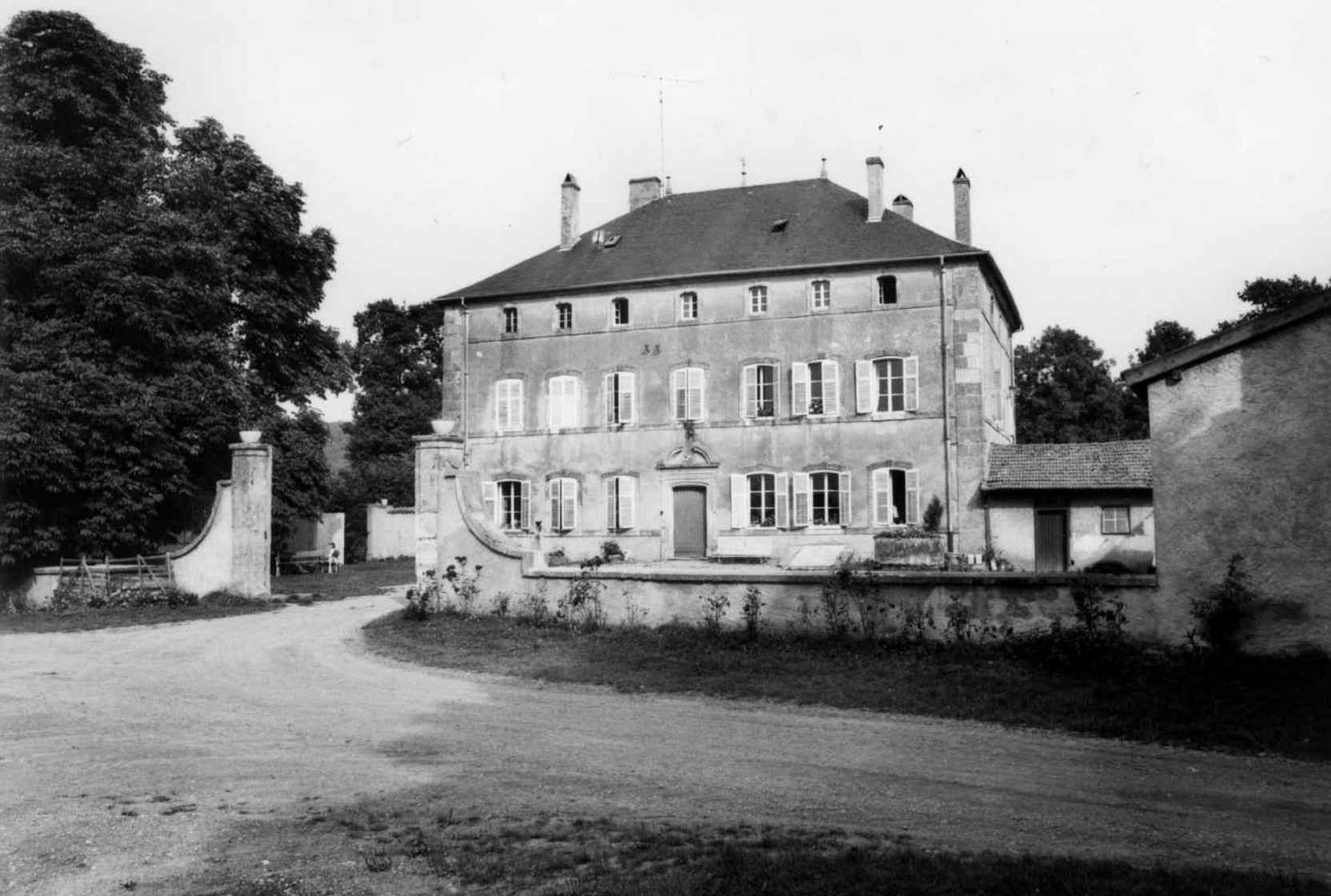
Fig. 8 Le logis abbatial, vue depuis la basse-cour.