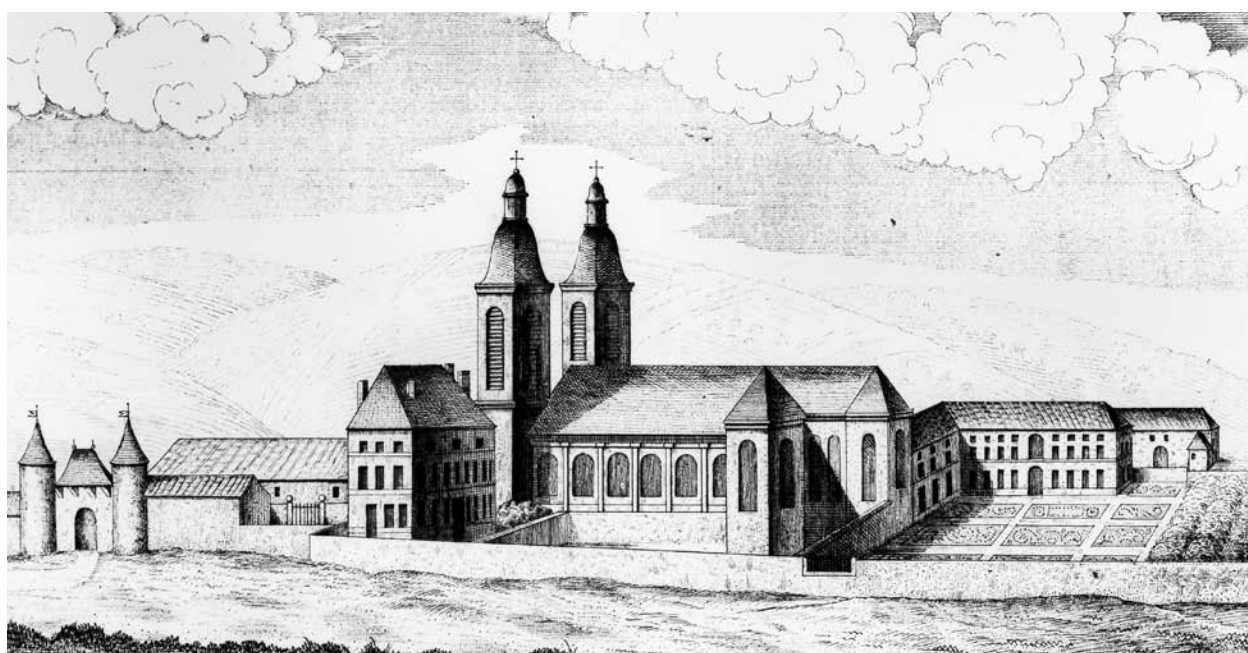
Fig. 5 Vue de l'abbaye en 1752.

Lith. I. Christophe, Nancy, 1846 (Nancy, Musée Historique Lorraine).