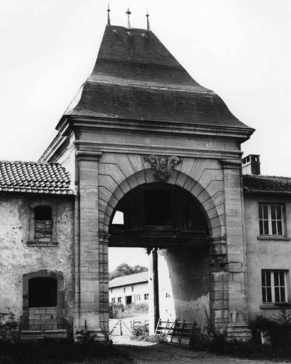
Fig. 4 Le pavillon d'entrée séparant la basse-cour de la 2 e cour ou manse abbatiale.