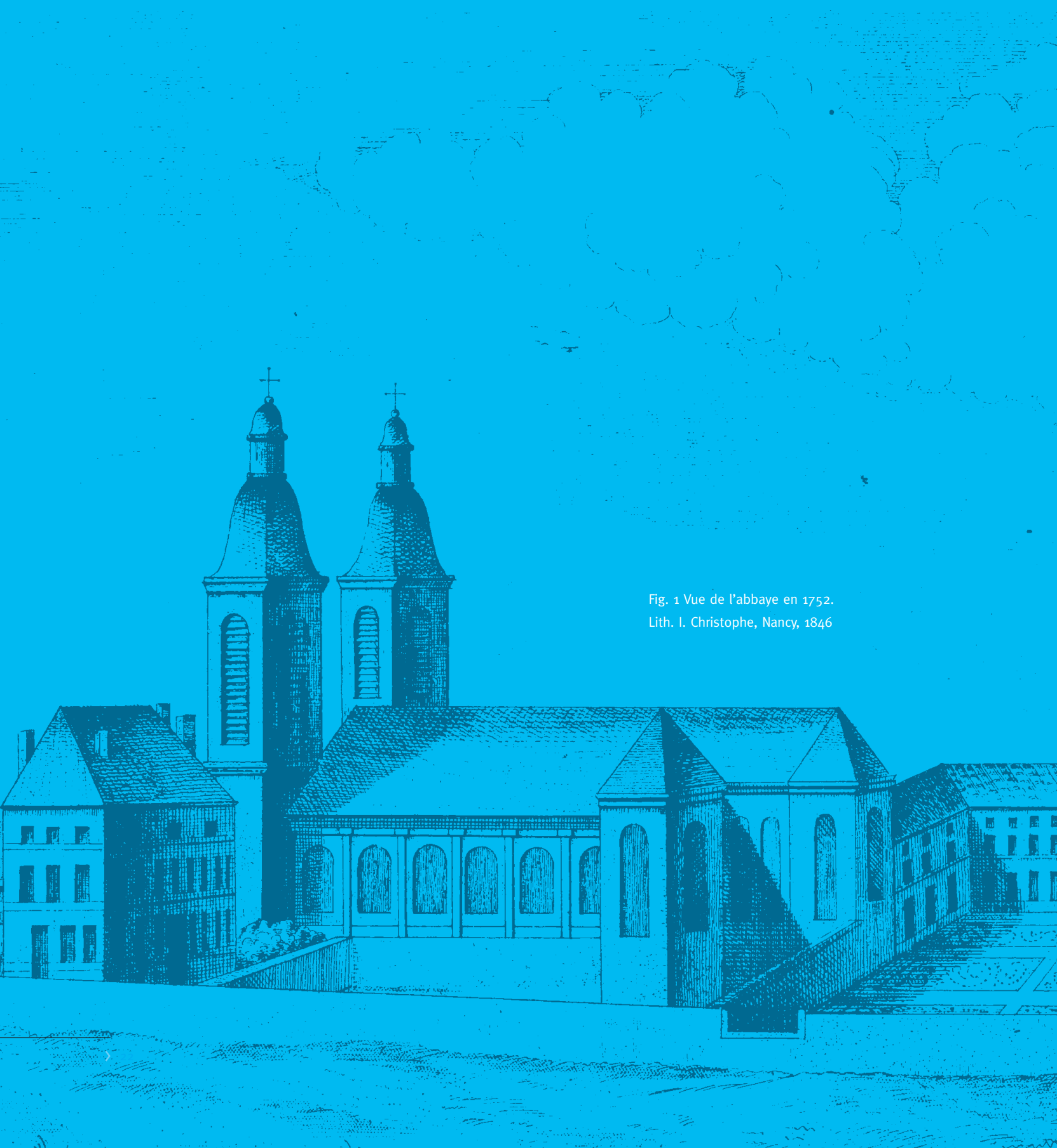
Fig. 1 Vue de l'abbaye en 1752. Lith. I. Christophe, Nancy, 1846