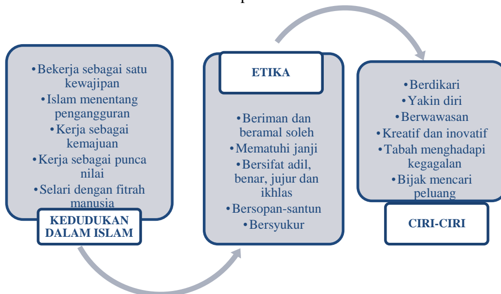
Carta 1: Konsep Usahawan Tani Islam