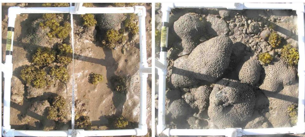
شکل ۲ کوادرات‌های عکس‌برداری شده از بستر گلی - قله‌سنگی (راست) و بستر ماسه‌ای - سنگی (چپ).